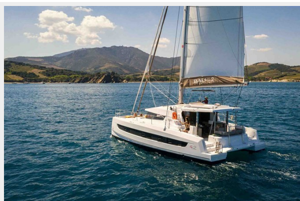
Bali 4.2 Gallery 2