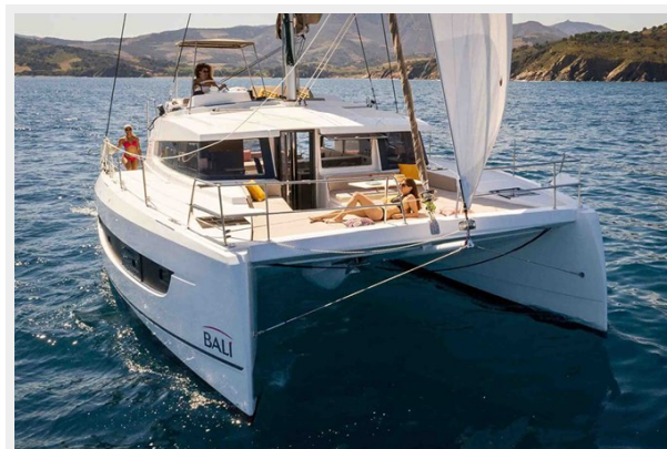
Bali 4.2 Gallery 3