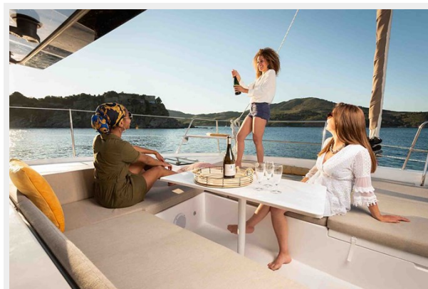
Bali 4.2 Gallery 5