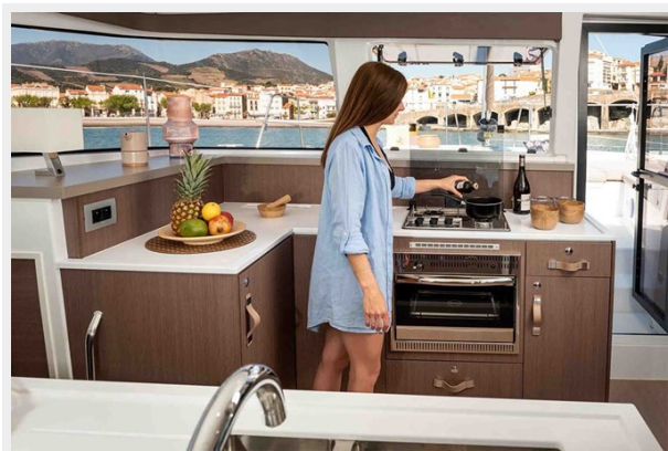
Bali 4.2 Gallery 8