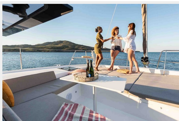
Bali 4.2 Gallery 4