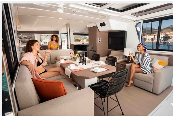
Bali 4.2 Gallery 6