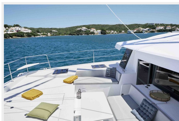
Bali 4.4 Gallery 3