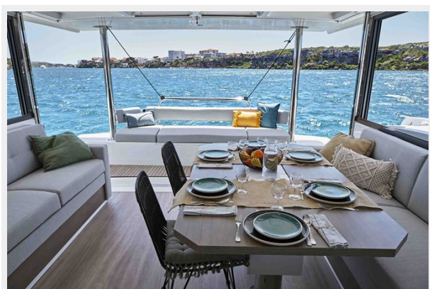
Bali 4.4 Gallery 4