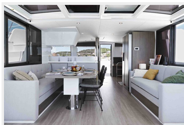
Bali 4.4 Gallery 5