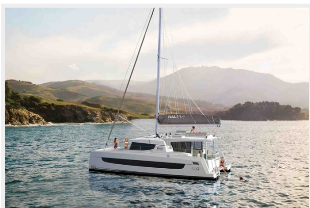
Bali 4.4 Gallery 2