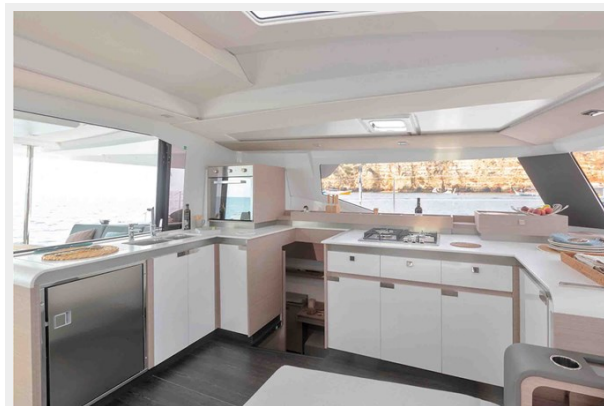
FP Elba 45 Gallery 9