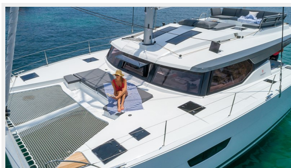
FP Elba 45 Gallery 5