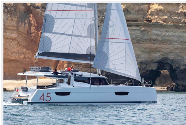
FP Elba 45 Gallery 3