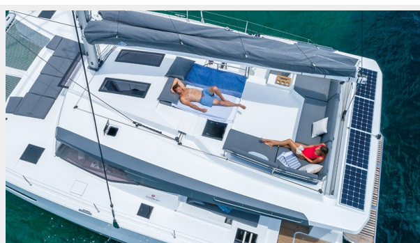
FP Elba 45 Gallery 6