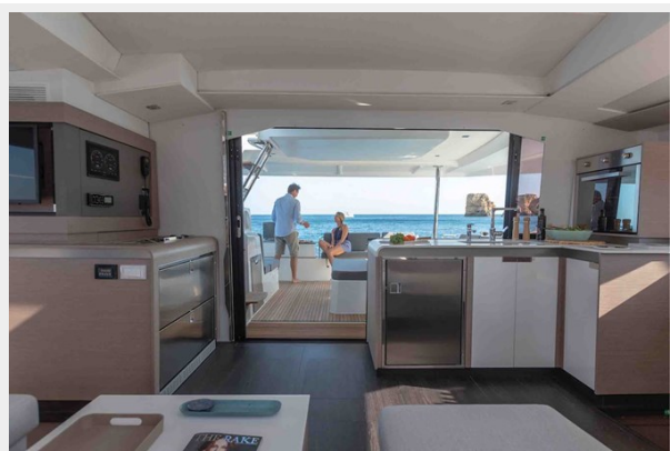
FP Elba 45 Gallery 8