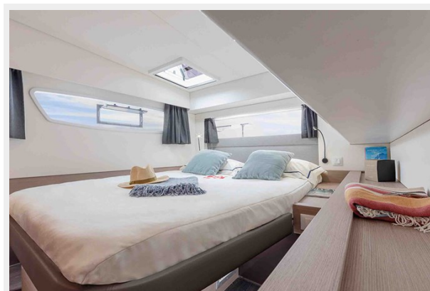
FP Elba 45 Gallery 11