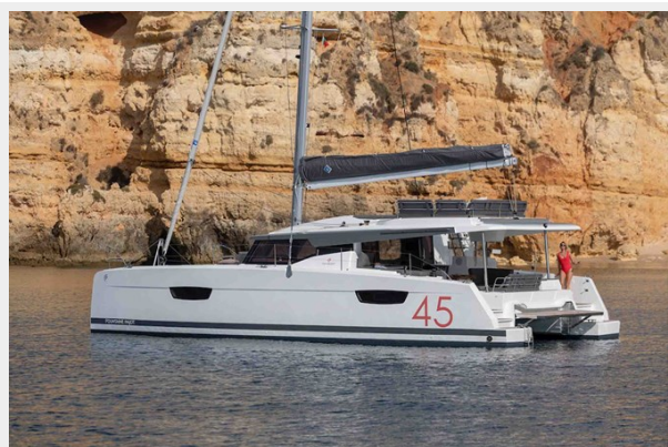
FP Elba 45 Gallery 2