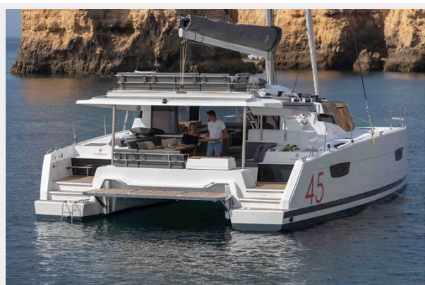
FP Elba 45 Gallery 4