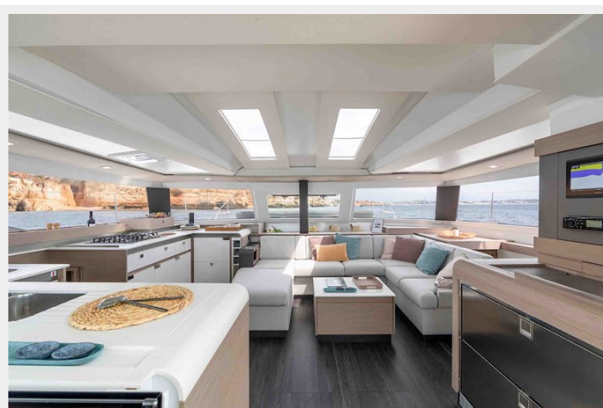
FP Elba 45 Gallery 10