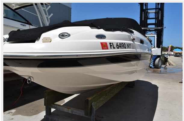
2005-chaparral-216-sunesta-power-9376414- 2005-chaparral-216-sunesta-power-9376414- 20240502175422597-1_XLARGE 20240502175405380-1_XLARGE