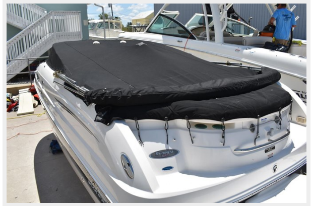
2005-chaparral-216-sunesta-power-9376414- 2005-chaparral-216-sunesta-power-9376414- 20240502175451094-1_XLARGE 20240502175455688-1_XLARGE