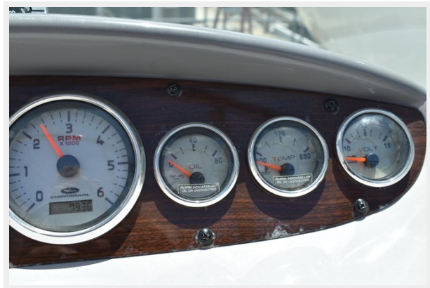
2005-chaparral-216-sunesta-power-9376414- 2005-chaparral-216-sunesta-power-9376414- 20240502175550094-1_XLARGE 20240502175554843-1_XLARGE