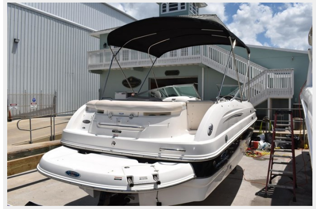
2005-chaparral-216-sunesta-power-9376414- 2005-chaparral-216-sunesta-power-9376414- 20240502175726173-1_XLARGE 20240502175747987-1_XLARGE