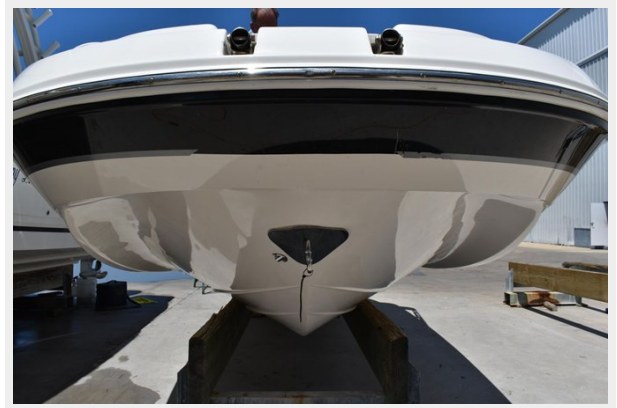
2005-chaparral-216-sunesta-power-9376414- 2005-chaparral-216-sunesta-power-9376414- 20240502175459797-1_XLARGE 20240502175503714-1_XLARGE