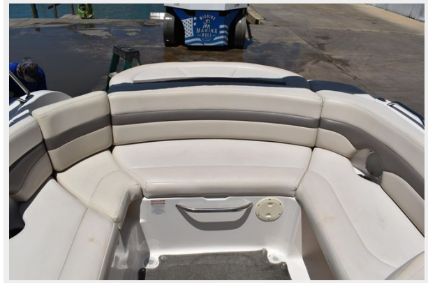
2005-chaparral-216-sunesta-power-9376414- 2005-chaparral-216-sunesta-power-9376414- 20240502175516762-1_XLARGE 20240502175521879-1_XLARGE