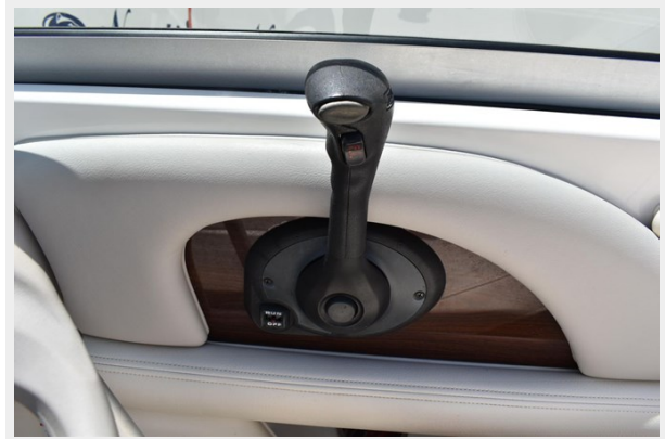
2005-chaparral-216-sunesta-power-9376414- 2005-chaparral-216-sunesta-power-9376414- 20240502175541699-1_XLARGE 20240502175545789-1_XLARGE