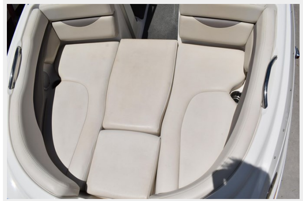
2005-chaparral-216-sunesta-power-9376414- 2005-chaparral-216-sunesta-power-9376414- 20240502175709841-1_XLARGE 20240502175713975-1_XLARGE