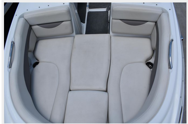
2005-chaparral-216-sunesta-power-9376414- 2005-chaparral-216-sunesta-power-9376414- 20240502175643022-1_XLARGE 20240502175647013-1_XLARGE