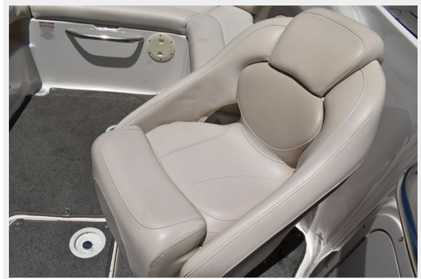
2005-chaparral-216-sunesta-power-9376414- 2005-chaparral-216-sunesta-power-9376414- 20240502175525793-1_XLARGE 20240502175529777-1_XLARGE