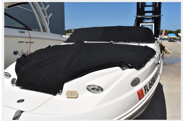
2005-chaparral-216-sunesta-power-9376414- 2005-chaparral-216-sunesta-power-9376414- 20240502175426575-1_XLARGE 20240502175430687-1_XLARGE