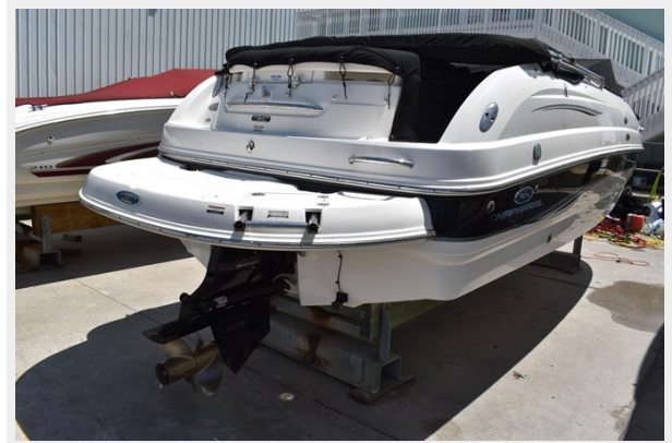
2005-chaparral-216-sunesta-power-9376414- 2005-chaparral-216-sunesta-power-9376414- 20240502175434883-1_XLARGE 20240502175438698-1_XLARGE