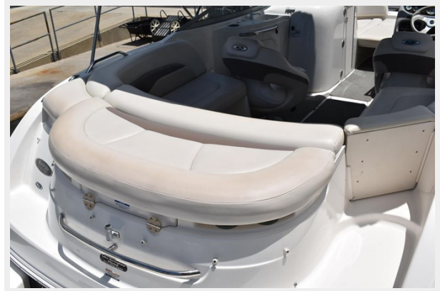
2005-chaparral-216-sunesta-power-9376414- 2005-chaparral-216-sunesta-power-9376414- 20240502175752291-1_XLARGE 20240502175757082-1_XLARGE