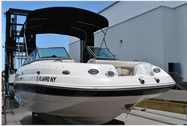
2005-chaparral-216-sunesta-power-9376414- 2005-chaparral-216-sunesta-power-9376414- 20240502175739966-1_XLARGE 20240502175743815-1_XLARGE