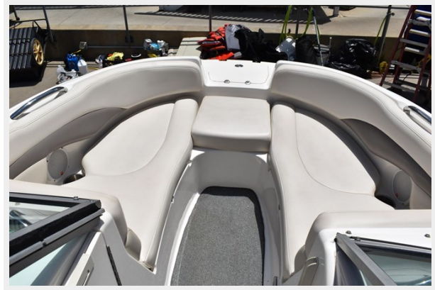
2005-chaparral-216-sunesta-power-9376414- 2005-chaparral-216-sunesta-power-9376414- 20240502175634899-1_XLARGE 20240502175639069-1_XLARGE