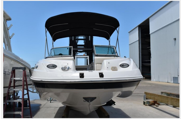
2005-chaparral-216-sunesta-power-9376414- 2005-chaparral-216-sunesta-power-9376414- 20240502175730934-1_XLARGE 20240502175418589-1_XLARGE