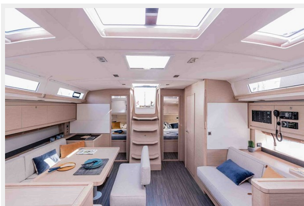
Dufour 470 Gallery 10