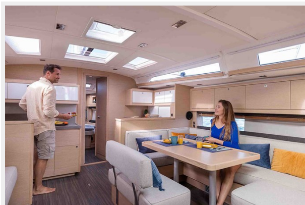
Dufour 470 Gallery 8