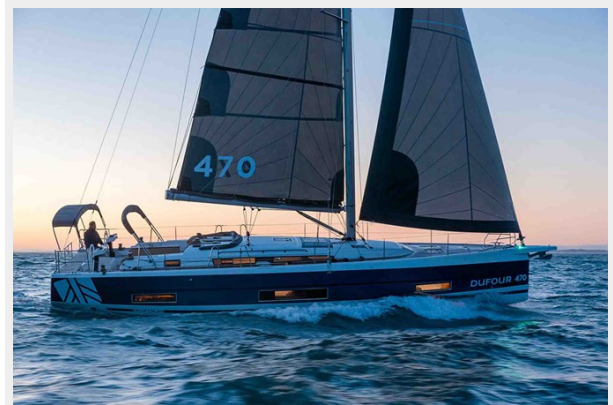
Dufour 470 Gallery 3