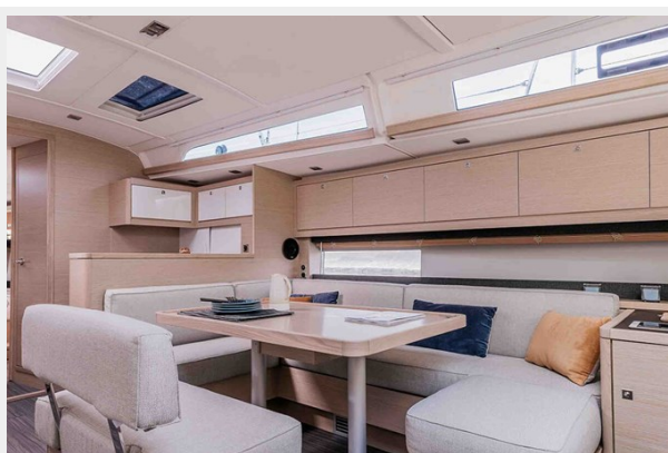
Dufour 470 Gallery 6