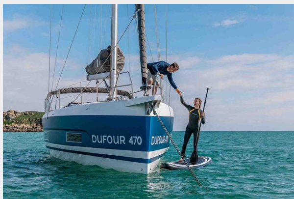
Dufour 470 Gallery 2