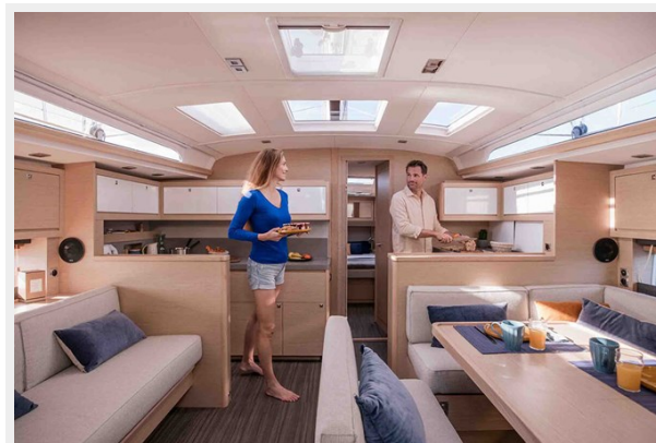
Dufour 470 Gallery 9