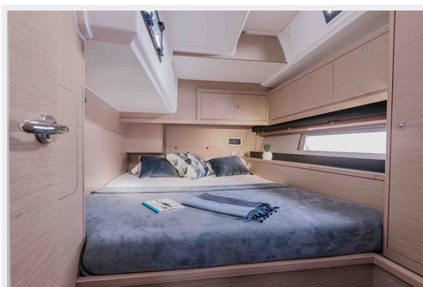
Dufour 470 Gallery 12