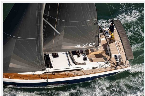
Dufour 470 Gallery 5