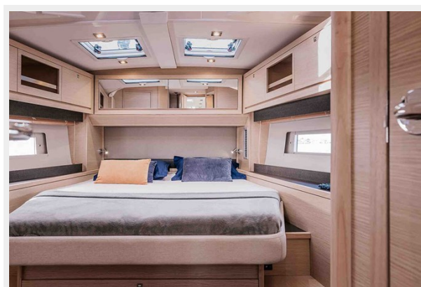
Dufour 470 Gallery 11