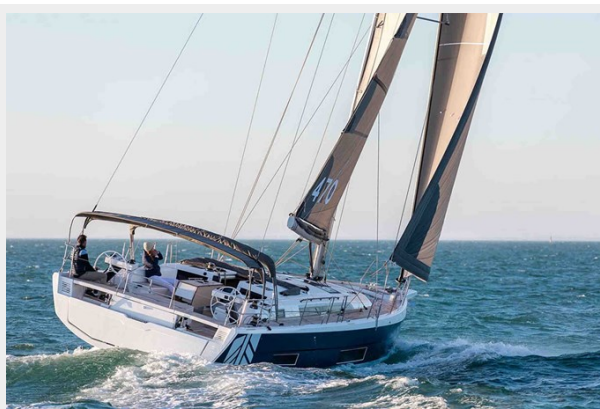
Dufour 470 Gallery 4