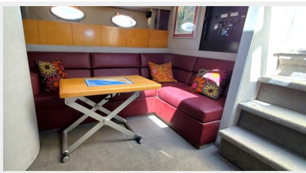
Fold out Salon Bed