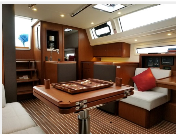
Salon Dining Table