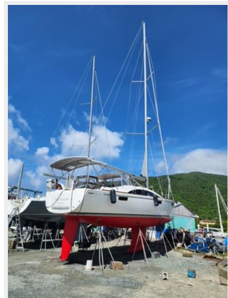
Starboard Side Out of Water