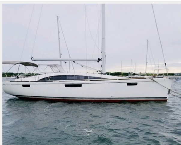
TWELFTH NIGHT 46' (14.02m) Bavaria 2015