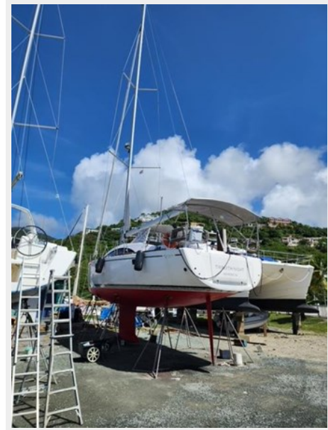
Starboard Side Out of Water