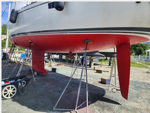
Keel with Centerboard