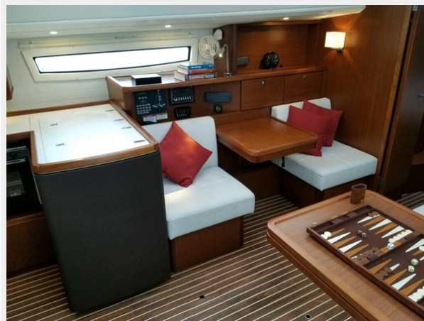
Port Side Salon Seating with Adjustable Table