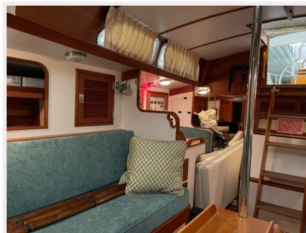
Salon Looking Aft