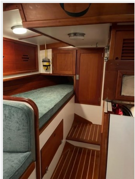
Walk-In Aft Quarter Berth