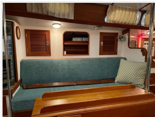
Salon Starboard Side