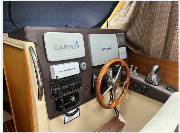
2013 C28 Dual Chart plotters