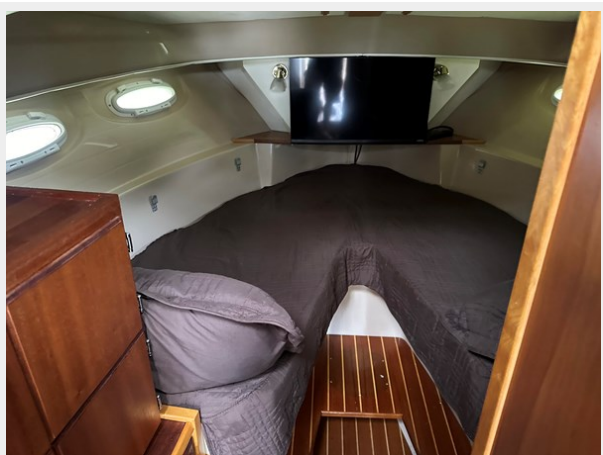
2013 C28 V-Birth