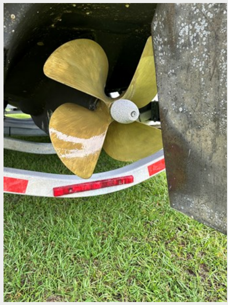
2013 C28 New Prop-speed