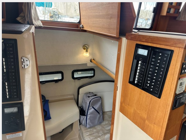
2017 Ranger Tug Sedan Aft Birth with day head