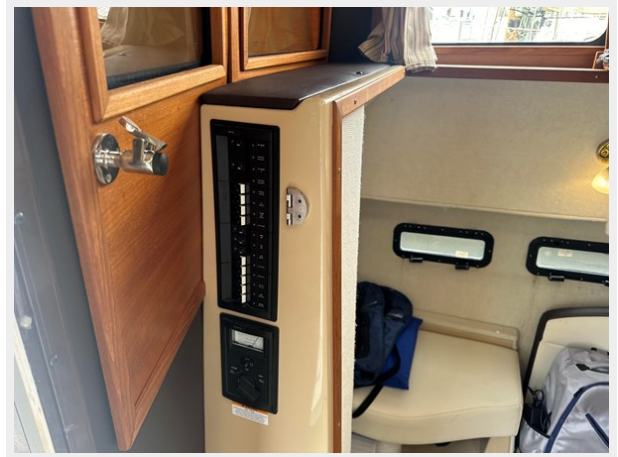
2017 Ranger Tug Sedan AC panel