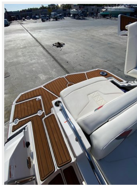
WhatsApp Image 2024-04-27 at 19.02.16