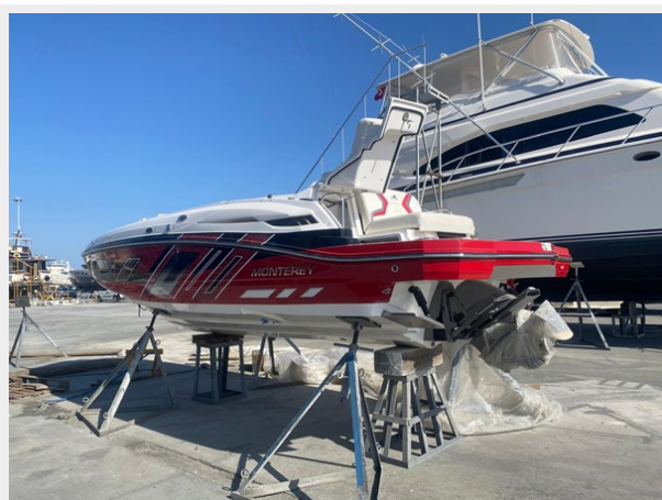
WhatsApp Image 2024-04-27 at 19.02.15 (3)