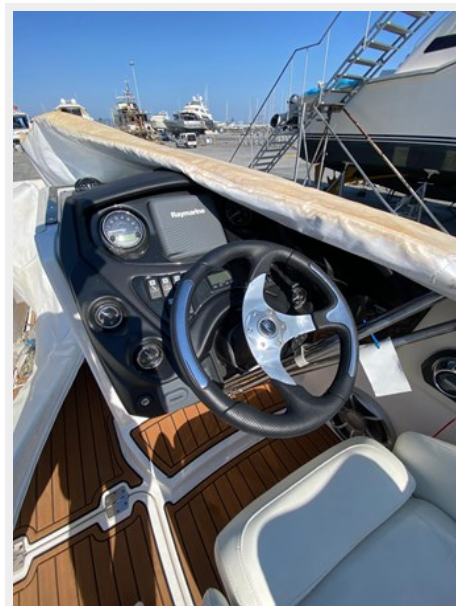
WhatsApp Image 2024-04-27 at 19.02.16 (3)