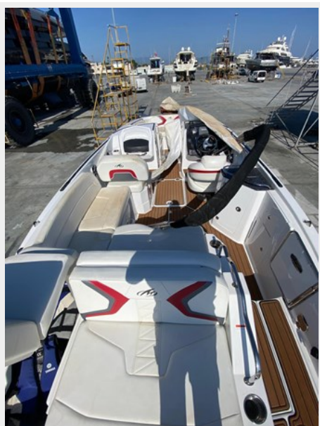
WhatsApp Image 2024-04-27 at 19.02.16 (2)