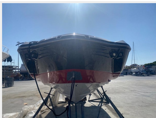
WhatsApp Image 2024-04-27 at 19.02.15 (4)