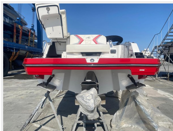
WhatsApp Image 2024-04-27 at 19.02.15