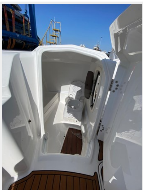
WhatsApp Image 2024-04-27 at 19.02.16 (4)