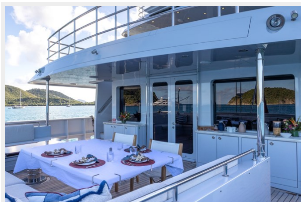
MAIN DECK AFT