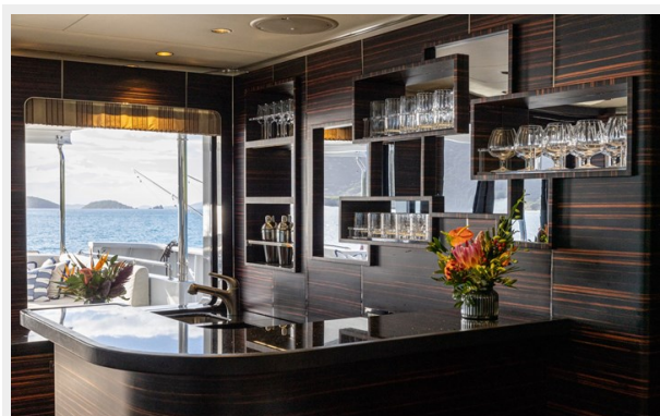
MAIN DECK SALON BAR