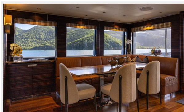
MAIN DECK INFORMAL DINING