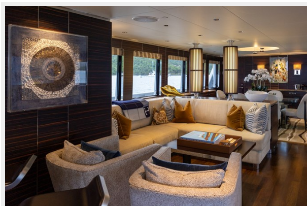
MAIN DECK SALON