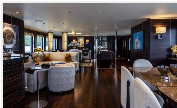
MAIN DECK SALON