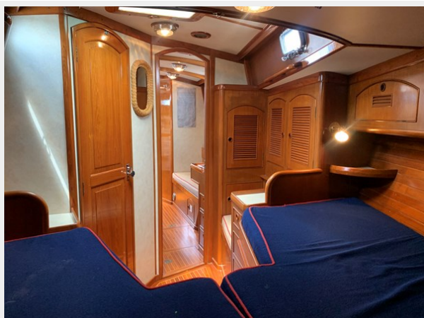
Forward Cabin Aft