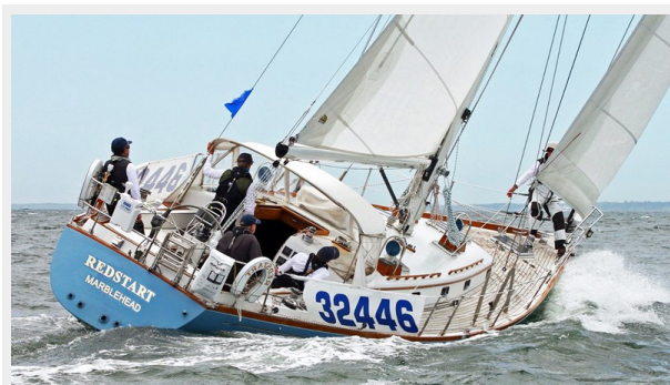
Racing to Bermuda