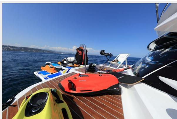
BAIA 100 _ Water leisure