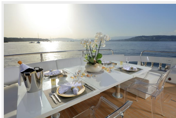
BAIA 100 aft deck dining area