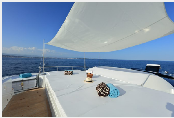
BAIA 100 fore deck