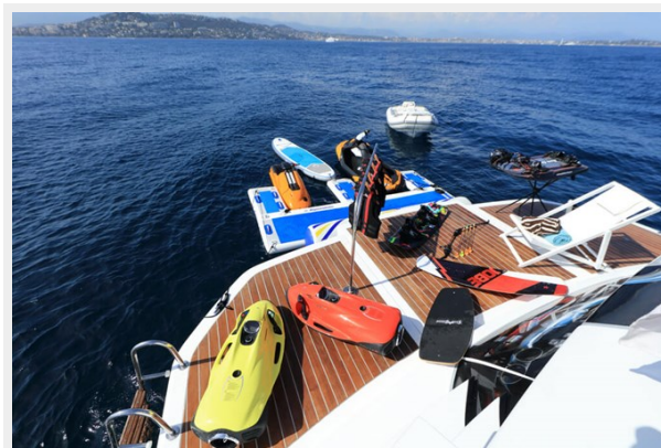
BAIA 100 Swimming platform and toys