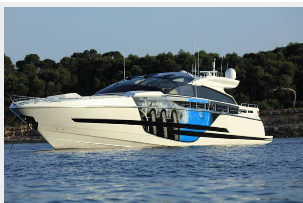
BAIA 100 profile