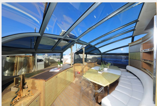
BAIA 100 interior -