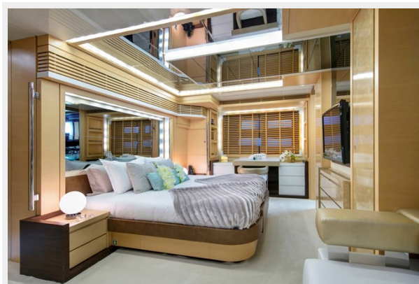
BAIA 100 Master