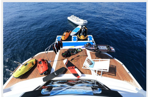
BAIA 100 toys