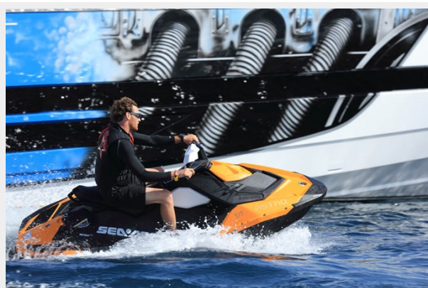
BAIA 100 jet ski