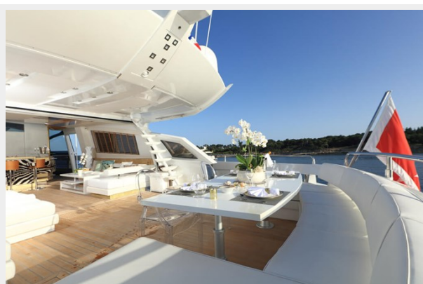
BAIA 100 aft deck