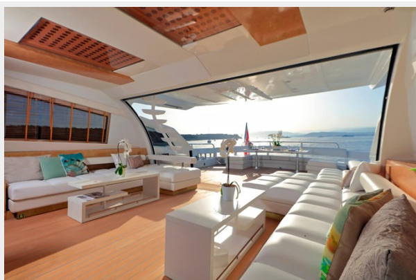
BAIA 100 views