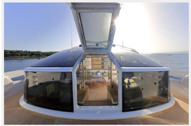
BAIA 100 interior views