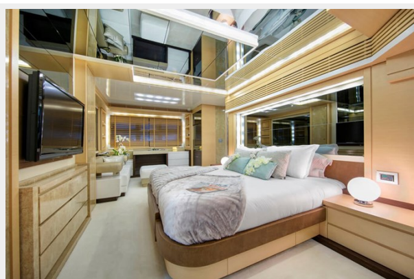
BAIA 100 Stateroom