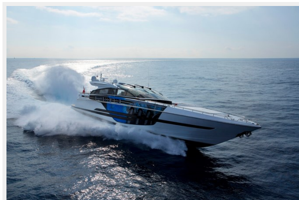
BAIA 100 fast planner