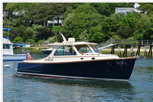
03 Pilothouse Exterior