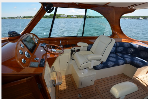
16 Helm Seat