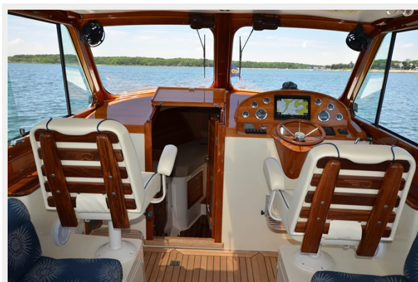
11 Helm Seats