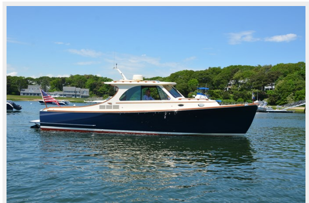
29 Starboard Side