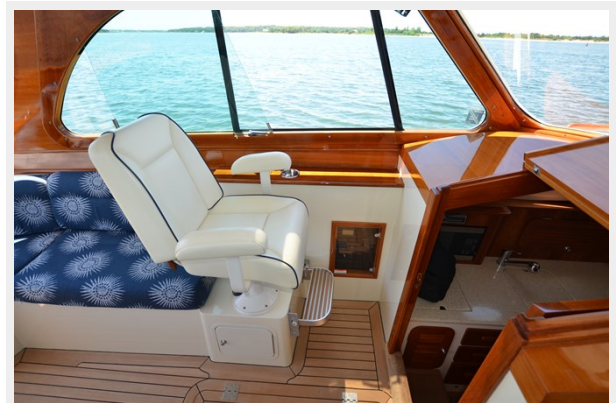
17 Navigators Seat