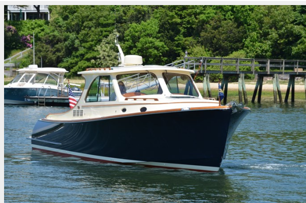
02 Starboard Bow