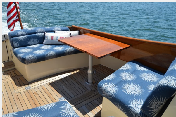
08 Aft Table Opened