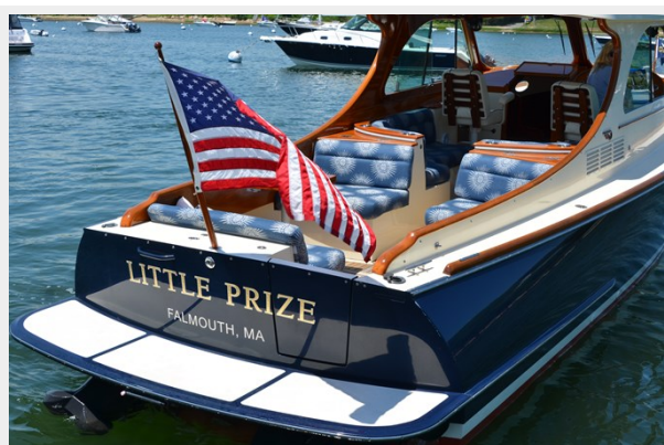
04 Swim Platform