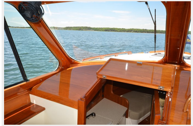
20 Pilothouse Portside