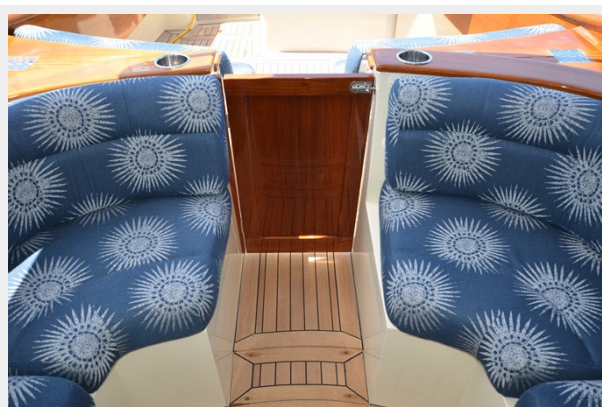
10 Kiddie Door