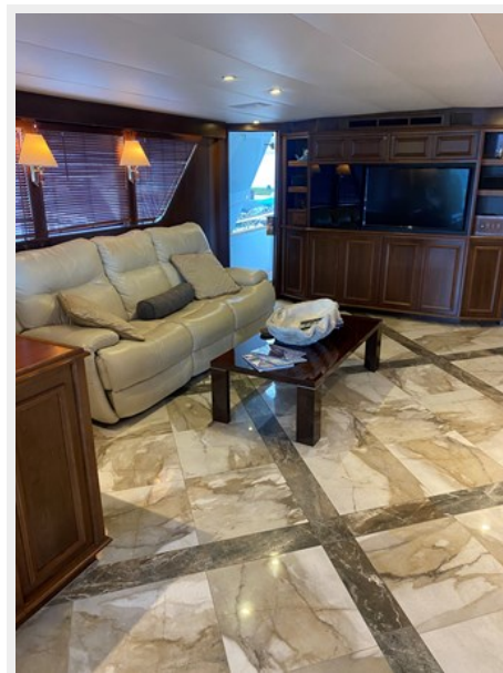
Main Salon, Forward to Port