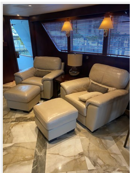
Main Salon, Forward to Starboard