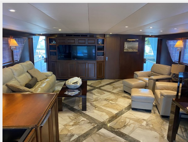
Main Salon, Forward