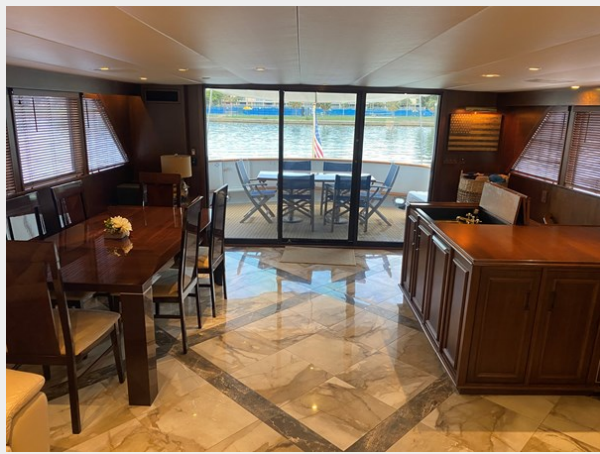
Main Salon Aft