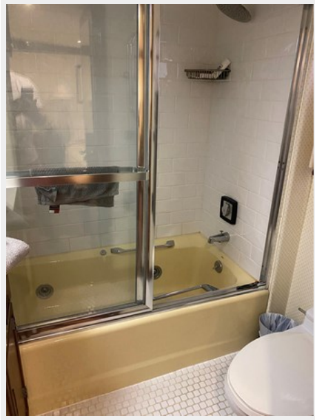
Guest Stateroom Bath, Port