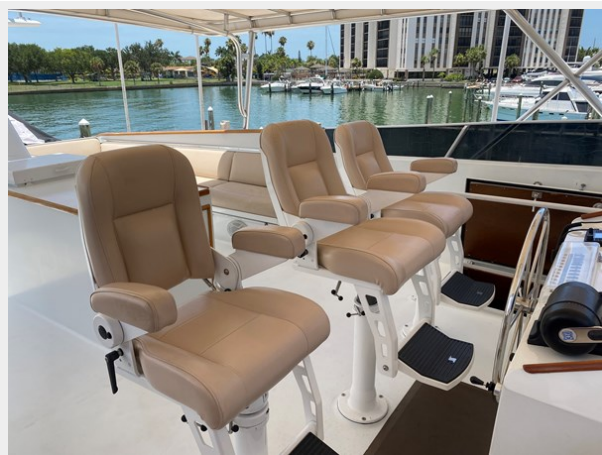
Flybridge Helm Seating