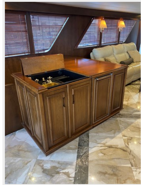
Main Salon Bar