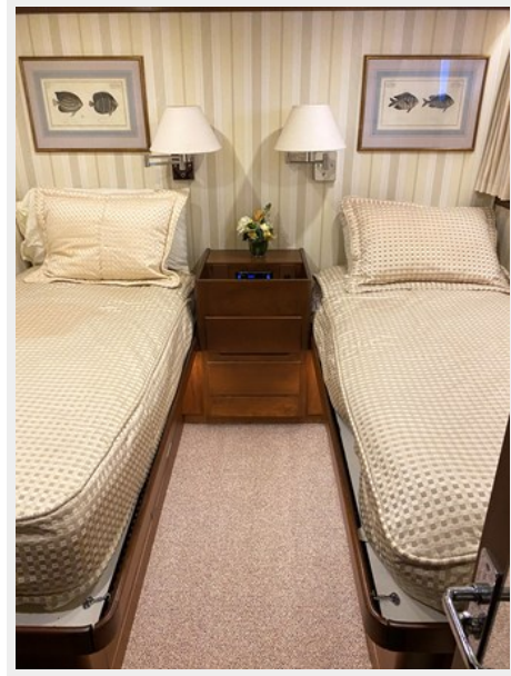
Guest Stateroom Starboard