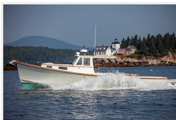
Port Side Underway