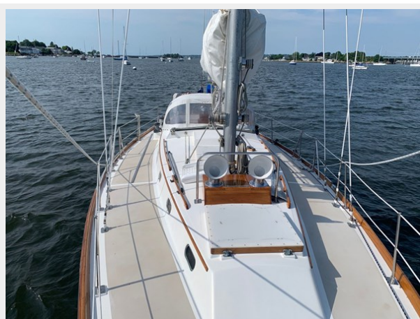
Mid Deck Aft