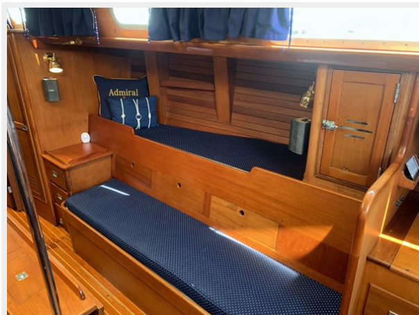
Main Salon Starboard Forward