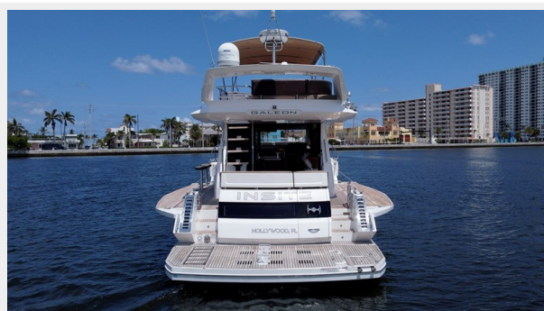
2017 Galeon 500 "insite"-22