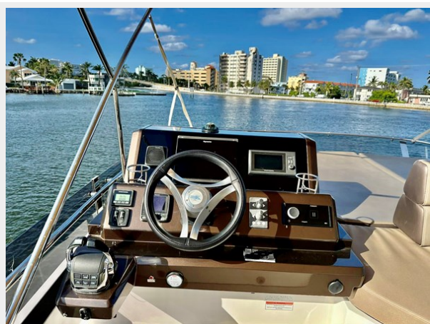
2017 Galeon 500 "insite"-61