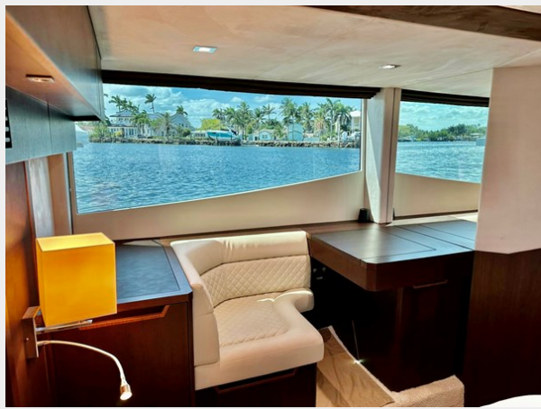
2017 Galeon 500 "insite"-170