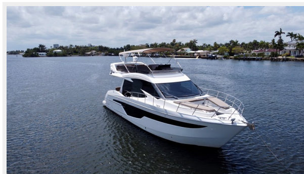
2017 Galeon 500 “insite”-3