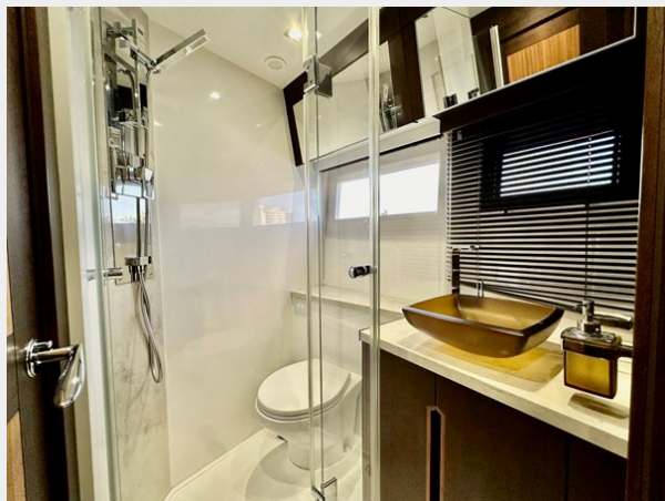
2017 Galeon 500 “insite”-158