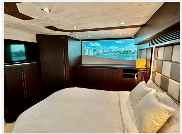
2017 Galeon 500 "insite"-172