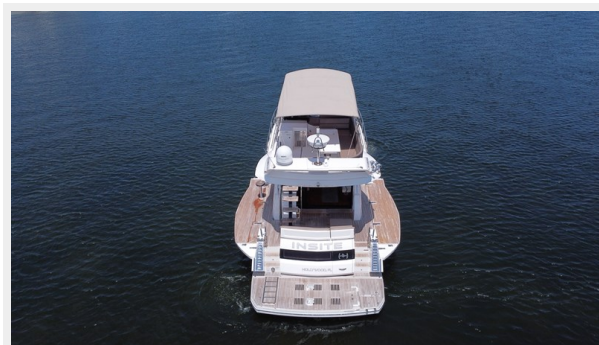
2017 Galeon 500 "insite"-28