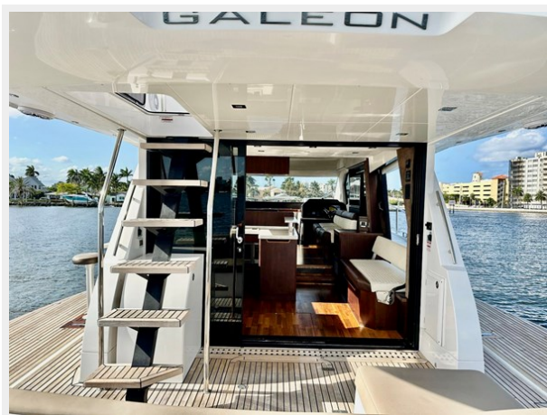
2017 Galeon 500 "insite"-88