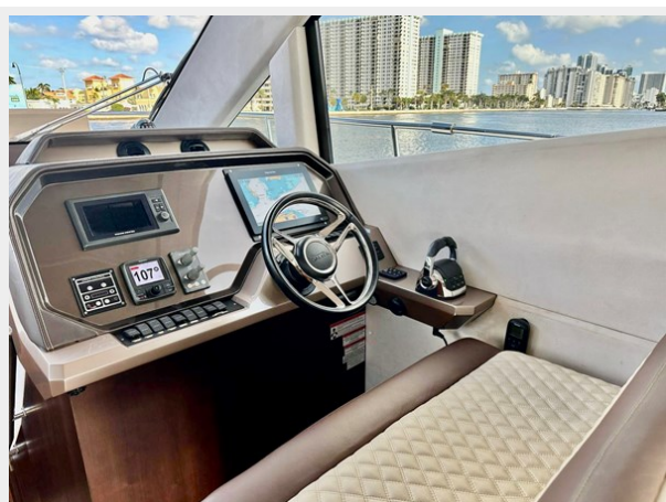
2017 Galeon 500 "insite"-124