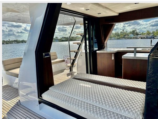
2017 Galeon 500 "insite"-71