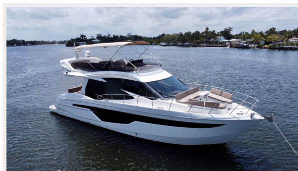
2017 Galeon 500 “insite”-13