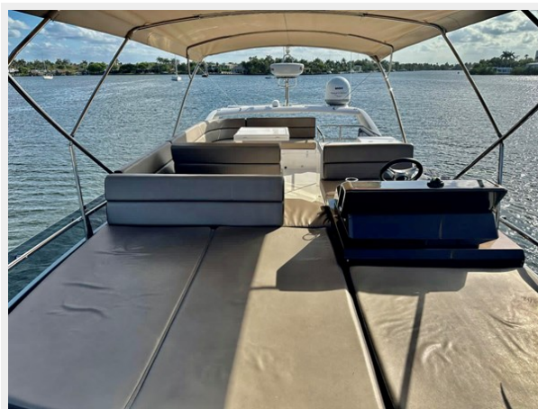
2017 Galeon 500 "insite"-65