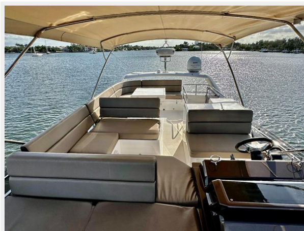
2017 Galeon 500 "insite"-57