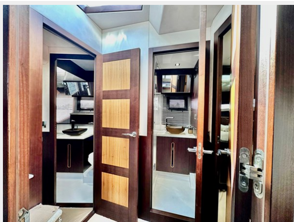
2017 Galeon 500 “insite”-157