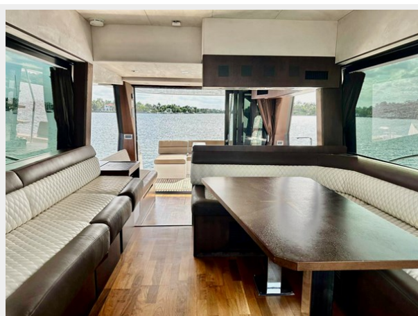
2017 Galeon 500 "insite"-130