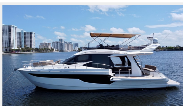
2017 Galeon 500 "insite"-31