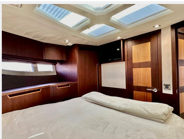
2017 Galeon 500 “insite”-160