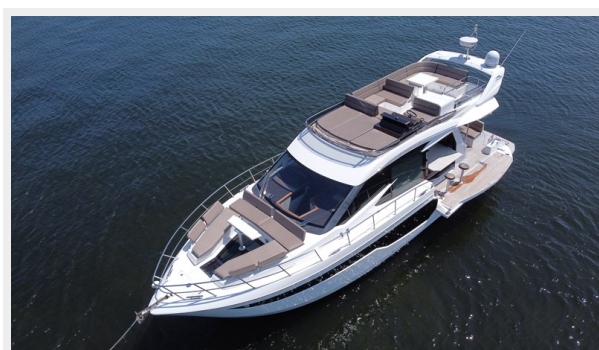
2017 Galeon 500 "insite"-41