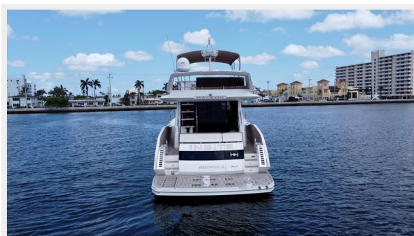
2017 Galeon 500 “insite”-9