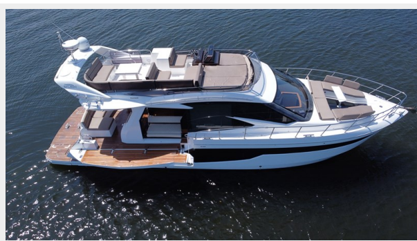
2017 Galeon 500 "insite"-42