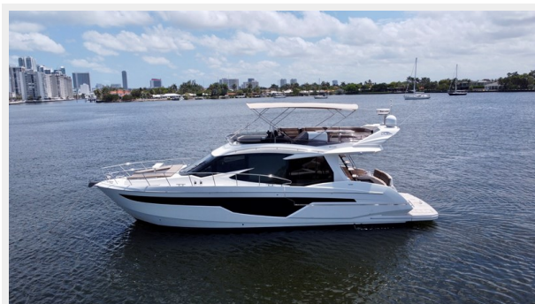
2017 Galeon 500 “insite”-1