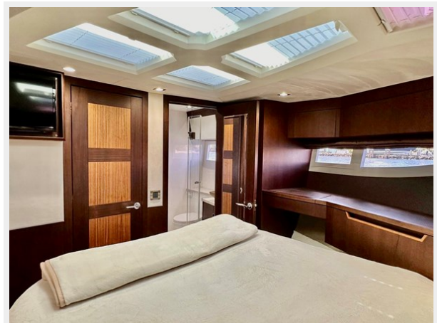
2017 Galeon 500 “insite”-161