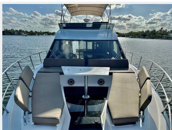
2017 Galeon 500 "insite"-50