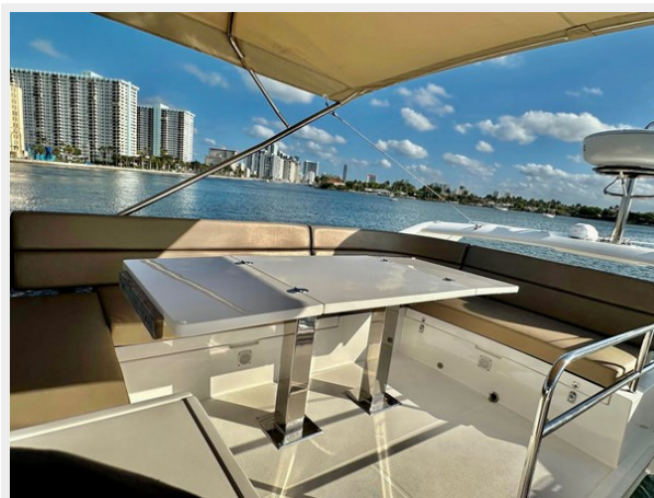
2017 Galeon 500 "insite"-49