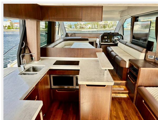
2017 Galeon 500 "insite"-99