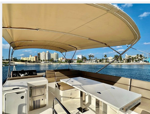
2017 Galeon 500 "insite"-51