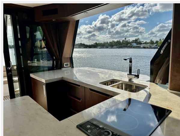
2017 Galeon 500 "insite"-82