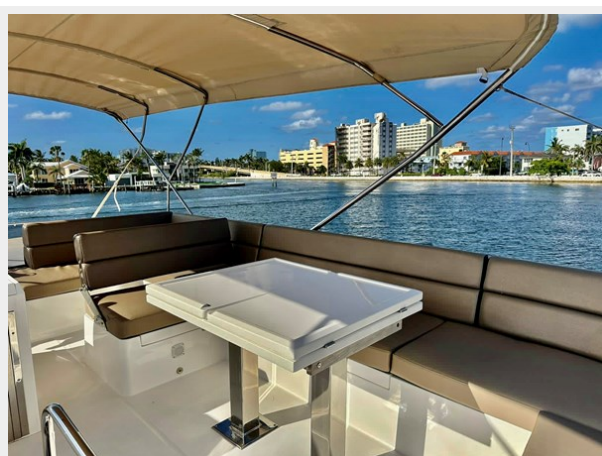
2017 Galeon 500 "insite"-60