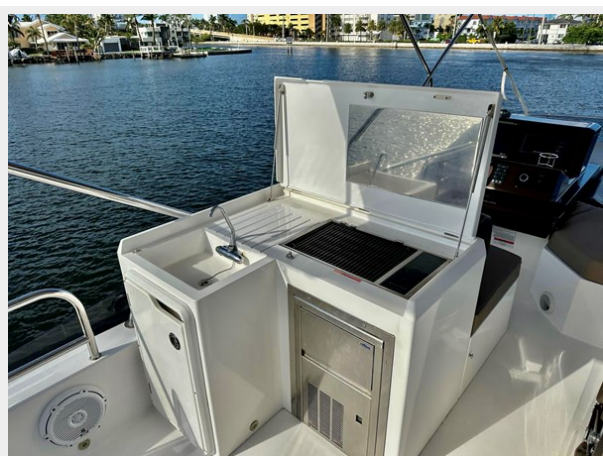
2017 Galeon 500 "insite"-68