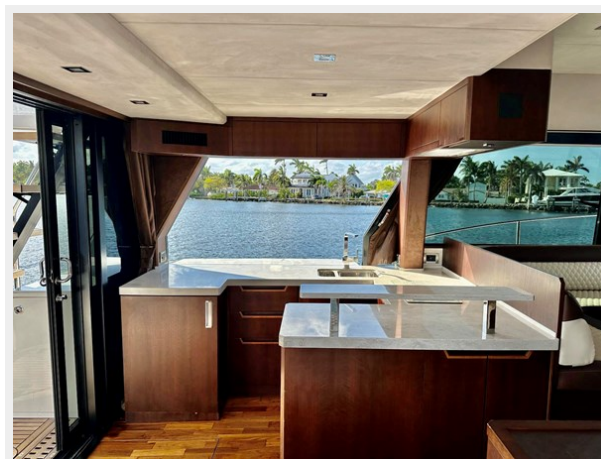
2017 Galeon 500 "insite"-92