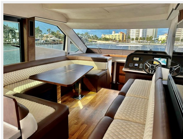
2017 Galeon 500 "insite"-115