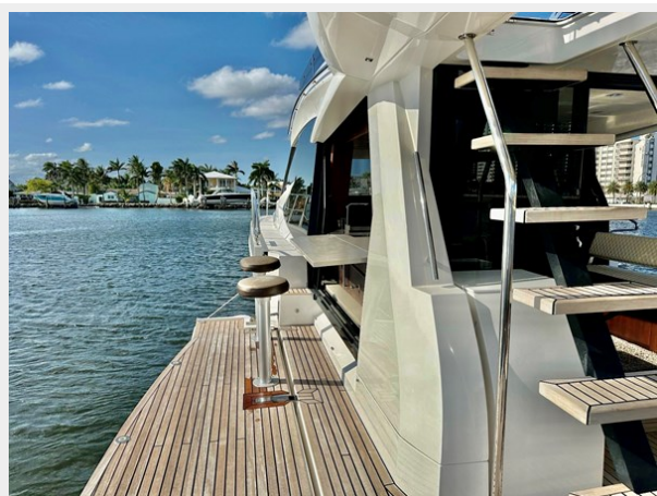
2017 Galeon 500 "insite"-73