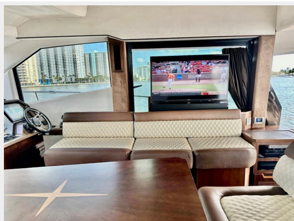
2017 Galeon 500 "insite"-113