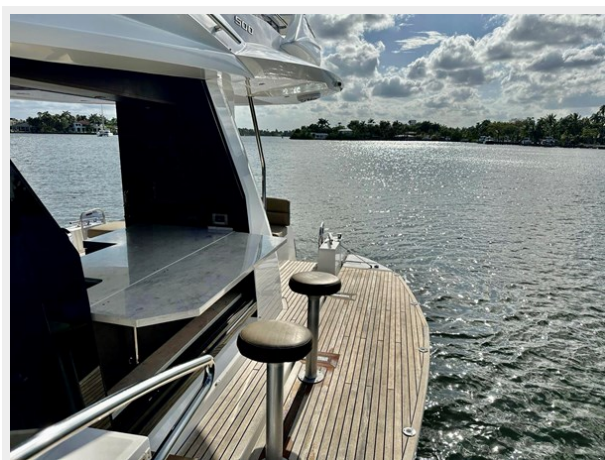
2017 Galeon 500 "insite"-107