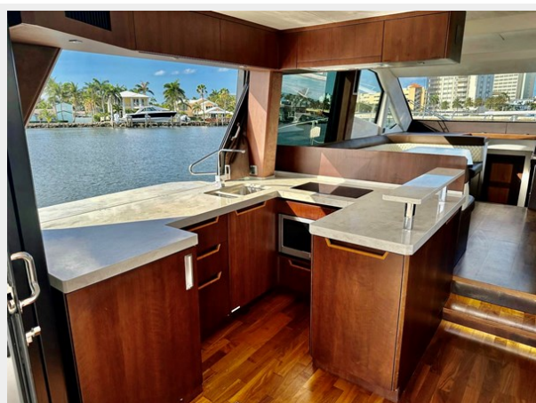
2017 Galeon 500 "insite"-83