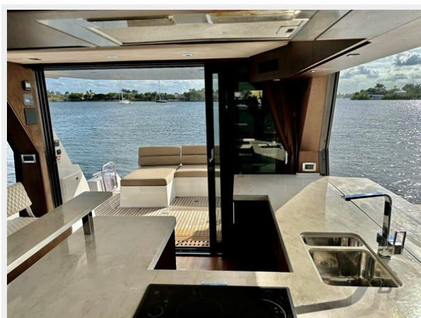
2017 Galeon 500 "insite"-96