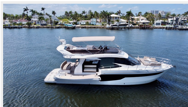
2017 Galeon 500 “insite”-17