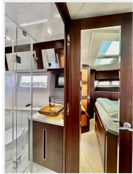
2017 Galeon 500 “insite”-159