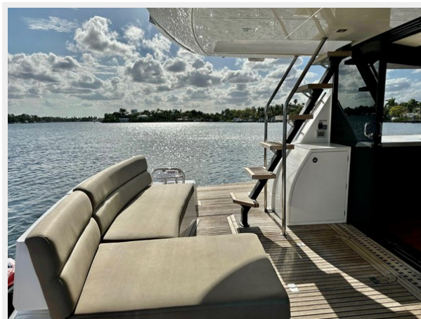
2017 Galeon 500 "insite"-76