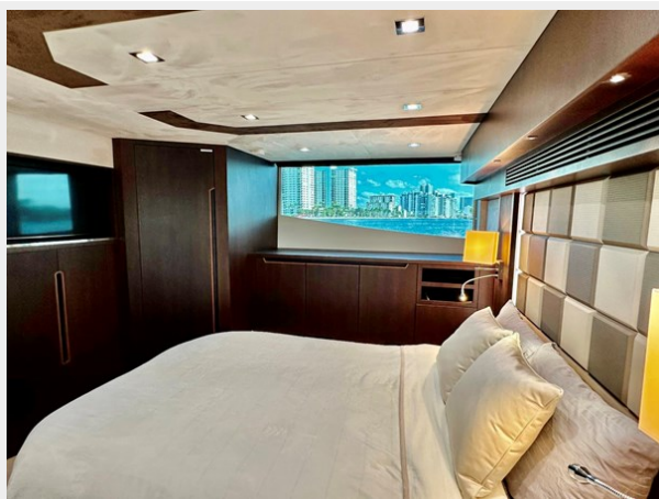
2017 Galeon 500 "insite"-173