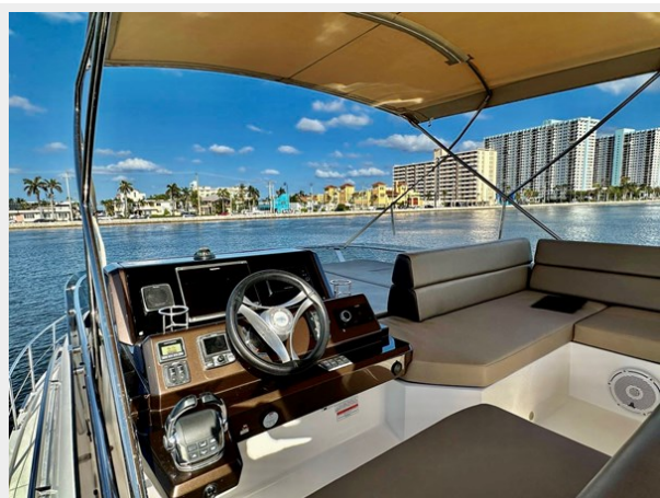
2017 Galeon 500 "insite"-55