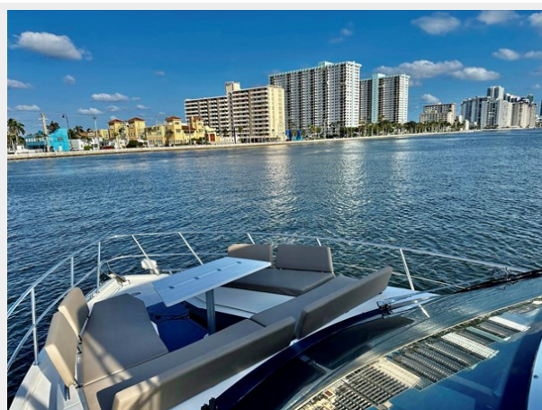
2017 Galeon 500 "insite"-53