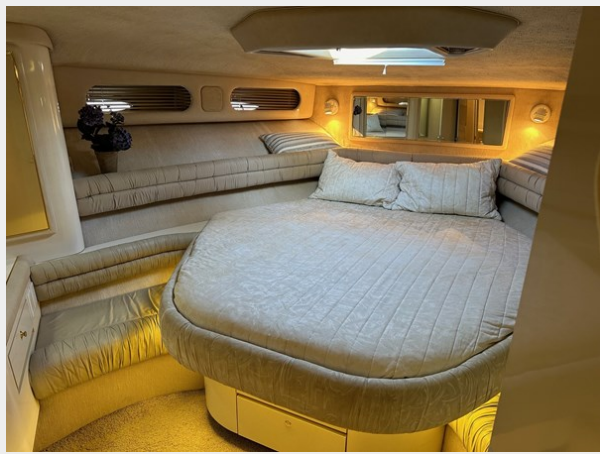
1995 SEA RAY 63 MASTER STATEROOM 2