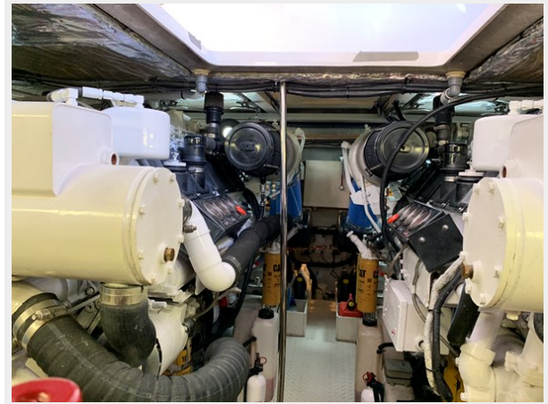
1995 SEA RAY 63 ENGINE ROOM 3