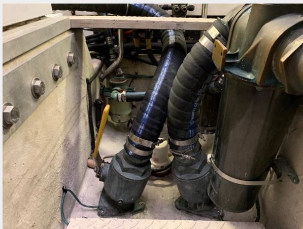
1995 SEA RAY 63 ENGINE ROOM 4