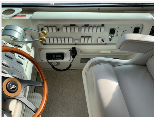
1995 SEA RAY 63 HELM CONTROL PANEL 2