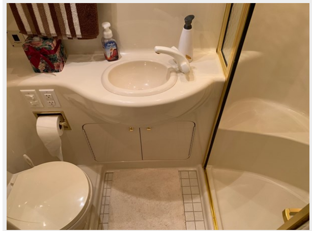
1995 SEA RAY 63 AFT HEAD