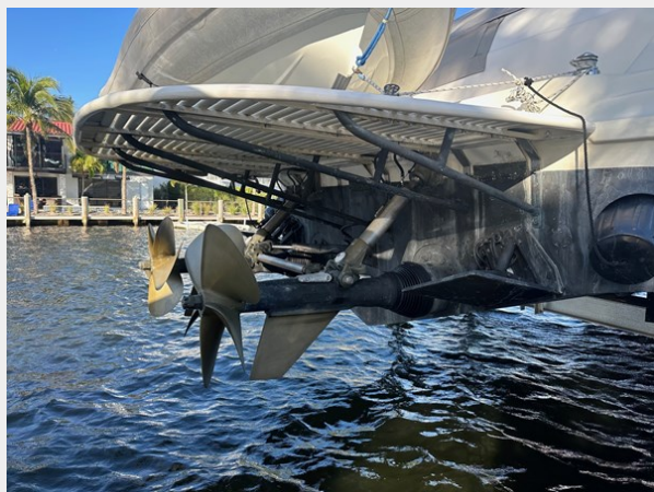
1995 SEA RAY 63 ARNESON SURFACE DRIVES