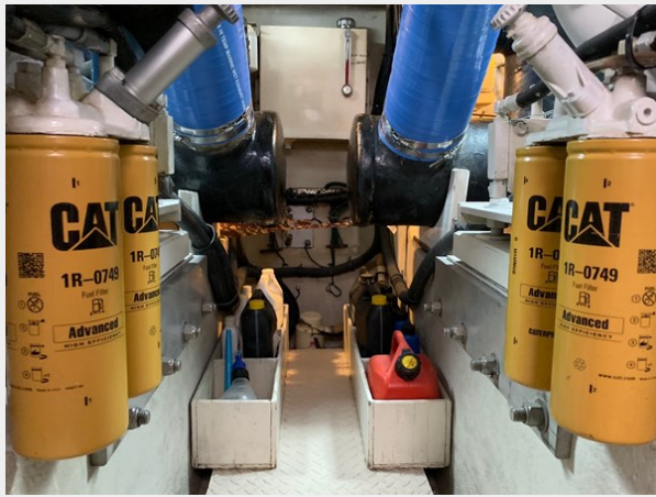
1995 SEA RAY 63 ENGINE ROOM 2