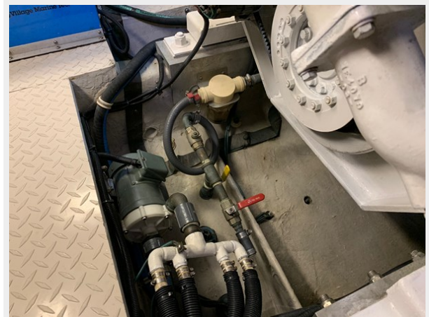
1995 SEA RAY 63 ENGINE ROOM 5