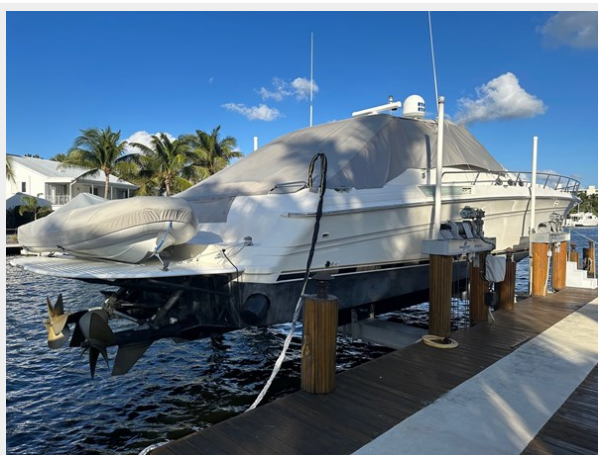
1995 SEA RAY 63 LIFT PROFILE