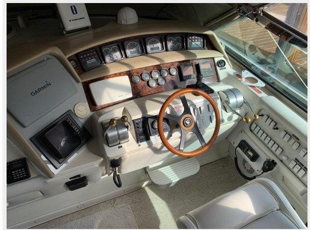
1995 SEA RAY 63 DRIVING AREA 2