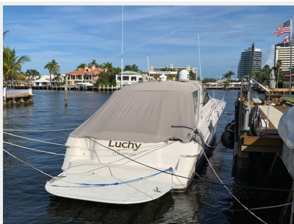
1995 SEA RAY 63 TRANSOM