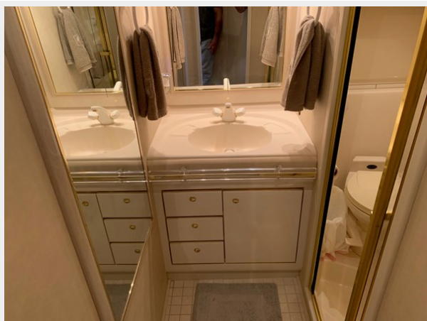
1995 SEA RAY 63 DAY HEAD