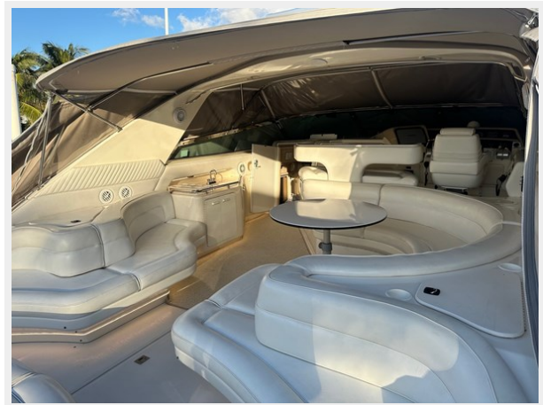
1995 SEA RAY 63 COCKPIT 2