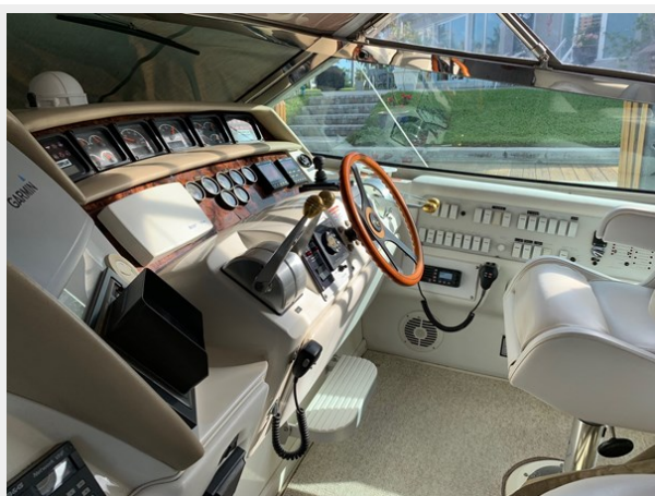
1995 SEA RAY 63 HELM