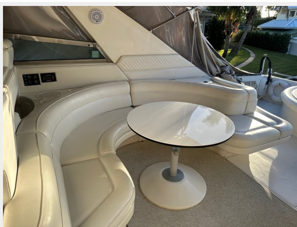
1995 SEA RAY 63 COCKPIT DINING