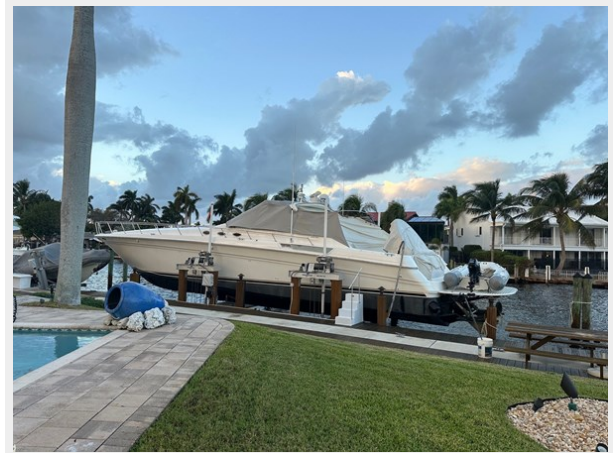
1995 SEA RAY 63 LIFT PROFILE 2