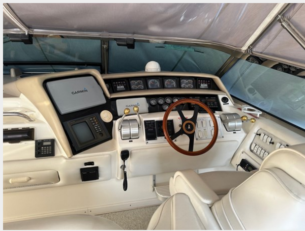
1995 SEA RAY 63 DRIVING AREA