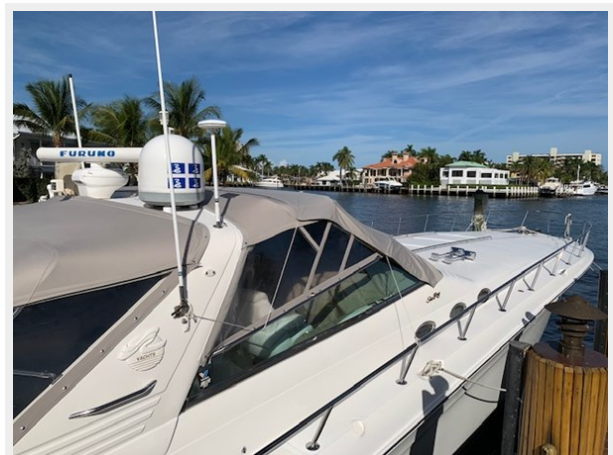
1995 SEA RAY 63 STARBOARD SIDE