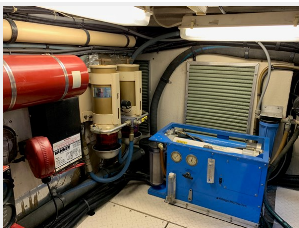
1995 SEA RAY 63 ENGINE ROOM EQUIPMENT