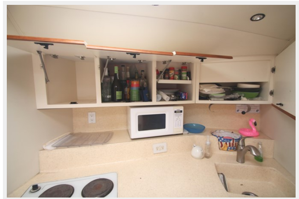
Storage above Galley