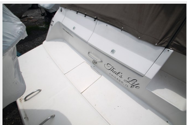
Swim Platform to Port