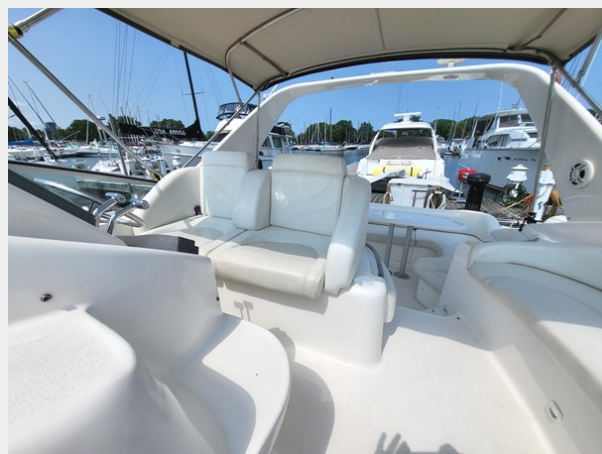
Cockpit Looking AFT