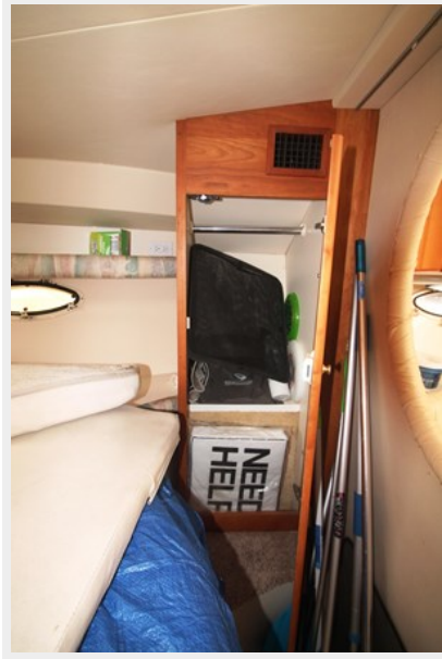
Hanging Locker to STBD