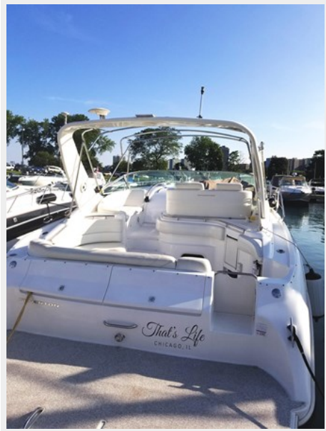
Transom Looking FWD