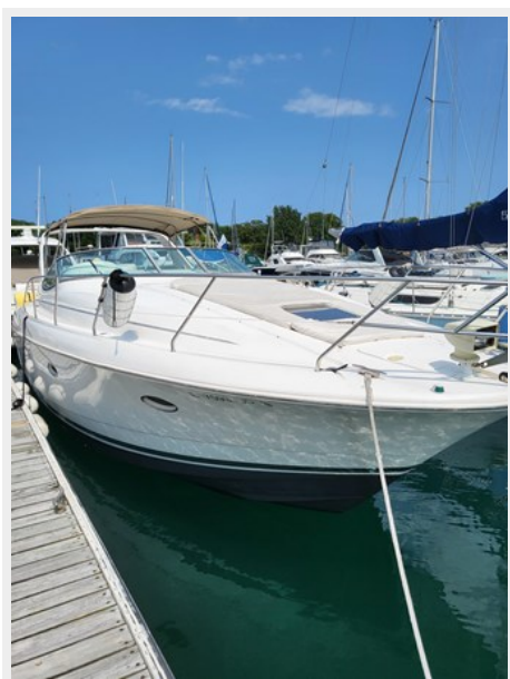
STBD FWD Quarter