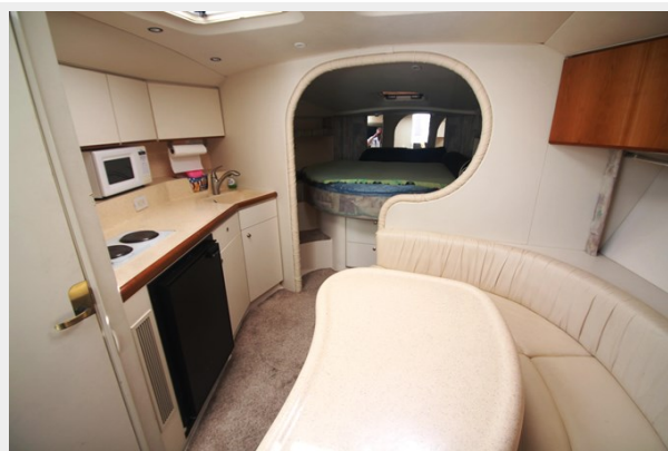
Salon Looking FWD