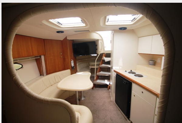
Cabin Looking AFT