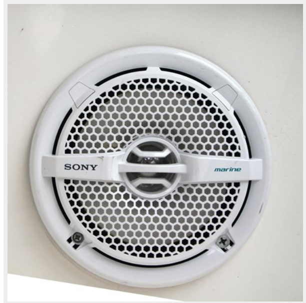
Speakers in Cockpit