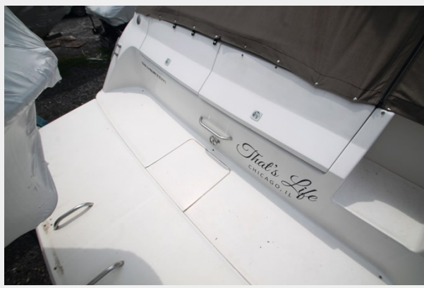
Swim Platform to Port