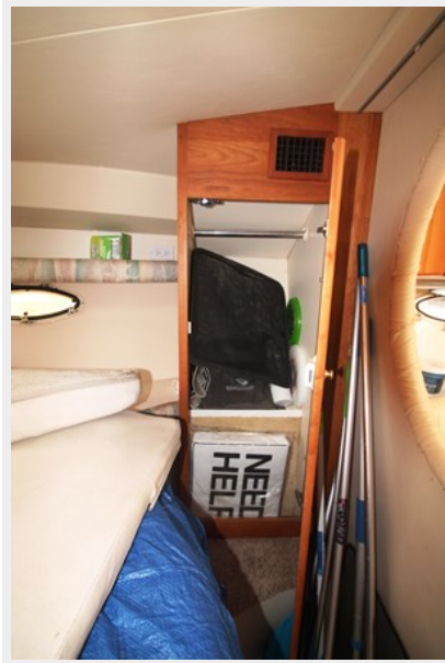
Hanging Locker to STBD