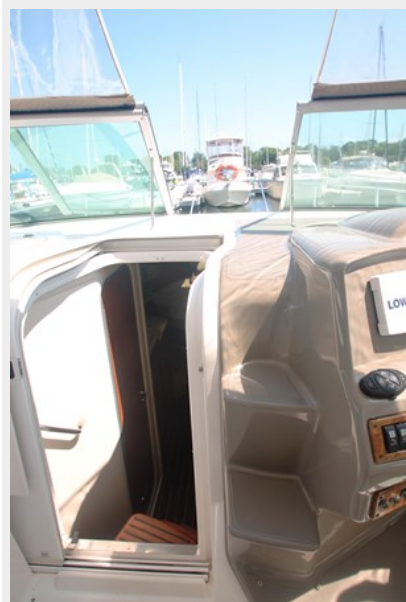
Walk Thru Windshield