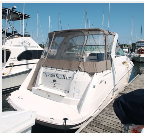
STBD AFT Quarter