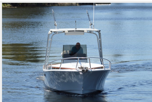
26 STRIKE 2023 BOW