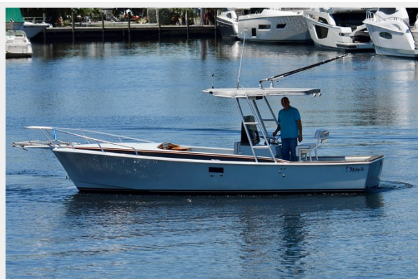
26 STRIKE 2023 PROFILE