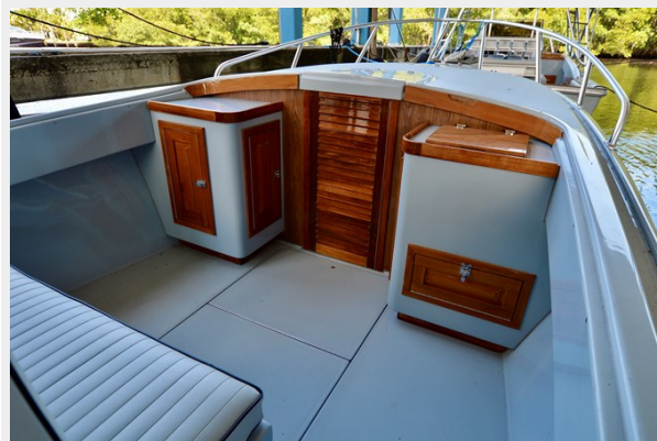
26 STRIKE 2023 FORWARD COCKPIT AREA