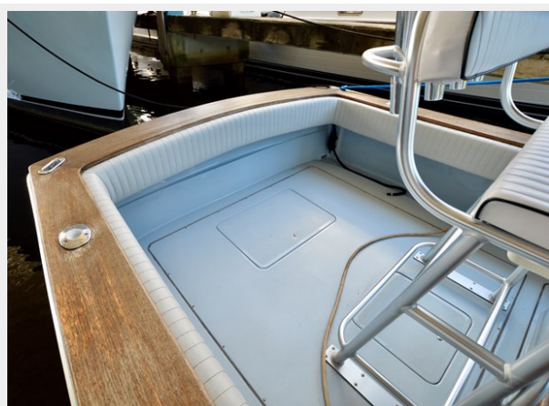
26 STRIKE 2023 COCKPIT