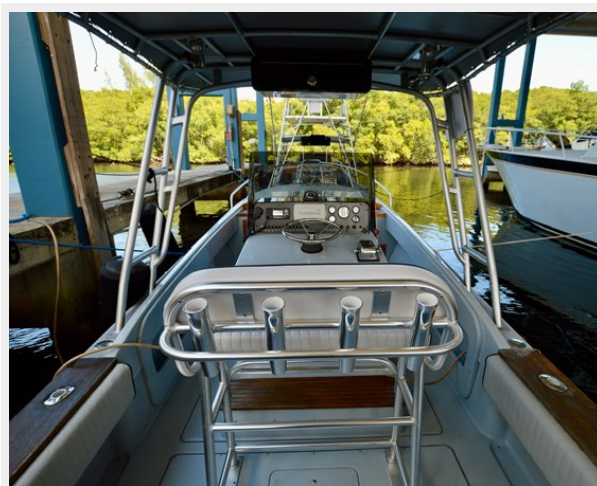
26 STRIKE 2023 HELM AREA