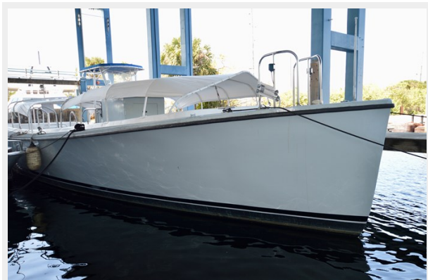
50 WILLARD 1979 BOW QUARTER PROFILE