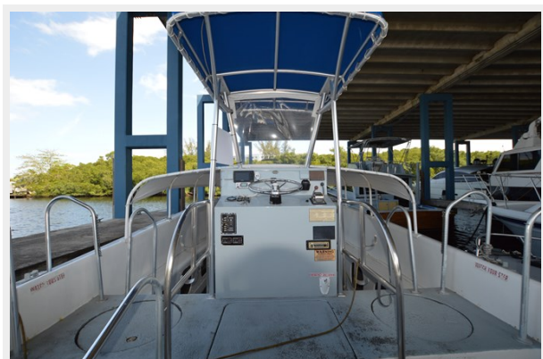
50 WILLARD 1979 HELM