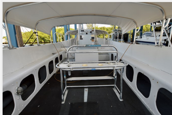
50 WILLARD 1979 AFT COCKPIT AND HELM