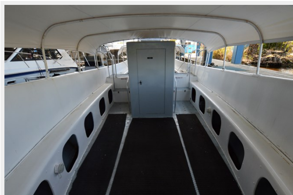
50 WILLARD 1979 FORWARD COCKPIT AND HEAD