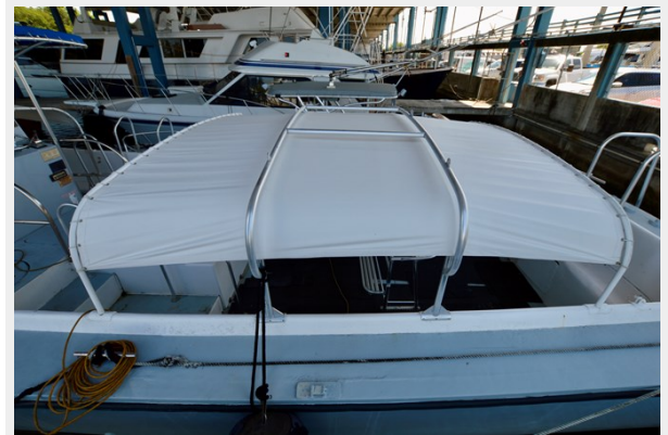
50 WILLARD 1979 CANOPY TOP