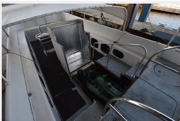
50 WILLARD 1979 ENGINE ACCESS