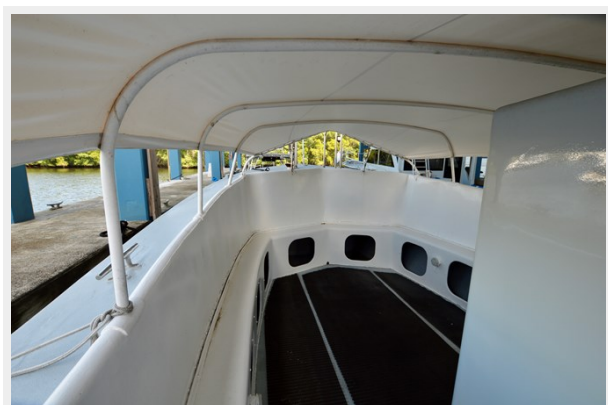
50 WILLARD 1979 FORWARD COCKPIT