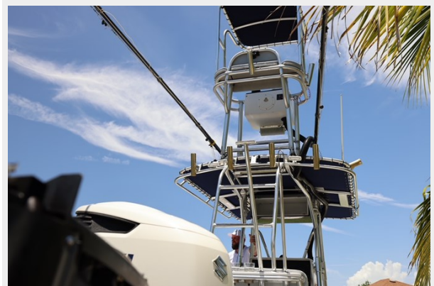
33_2001 30ft Contender 27 Open LATE FEES