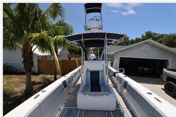
18_2001 30ft Contender 27 Open LATE FEES