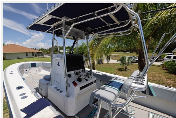
16_2001 30ft Contender 27 Open LATE FEES