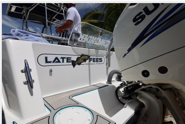
14_2001 30ft Contender 27 Open LATE FEES