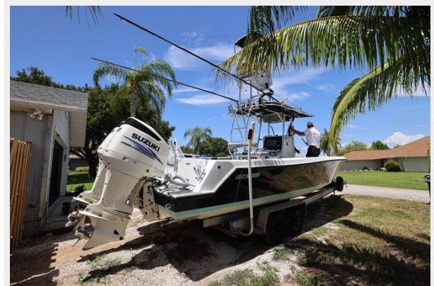
13_2001 30ft Contender 27 Open LATE FEES