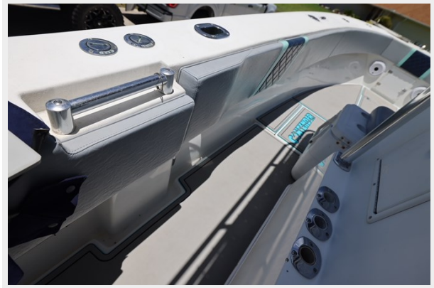
31_2001 30ft Contender 27 Open LATE FEES