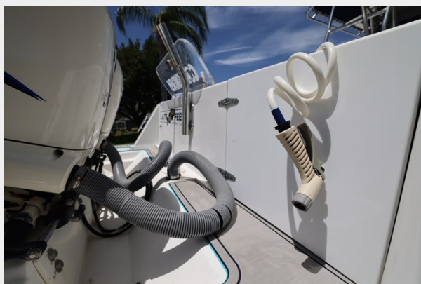
12_2001 30ft Contender 27 Open LATE FEES