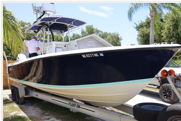
2_2001 30ft Contender 27 Open LATE FEES 3_2001 30ft Contender 27 Open LATE FEES