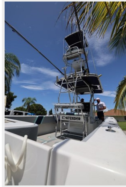
11_2001 30ft Contender 27 Open LATE FEES