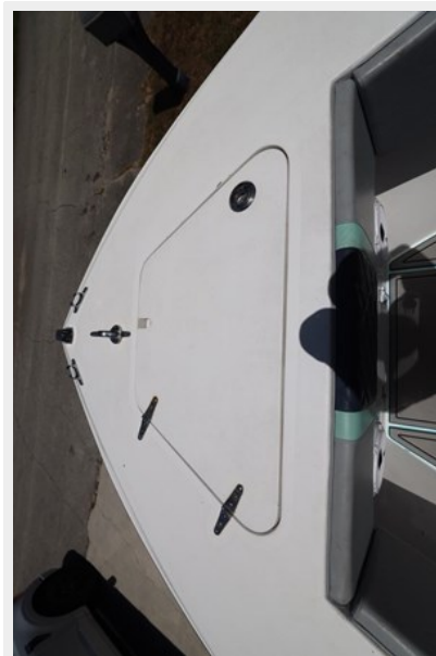
17_2001 30ft Contender 27 Open LATE FEES