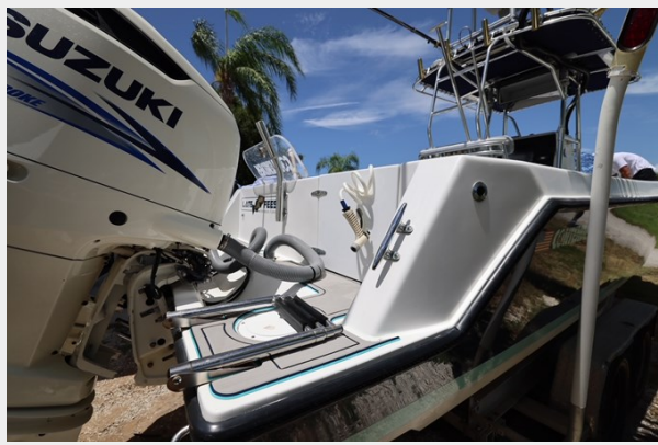
10_2001 30ft Contender 27 Open LATE FEES