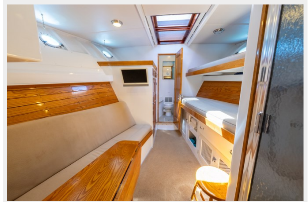
Crew Quarters Forward View