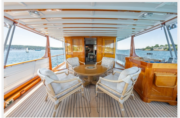
Fantail Forward View wing doors open