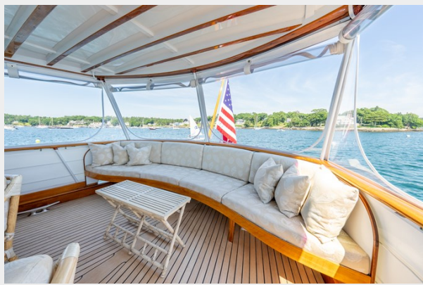
Aft Fantail Seating