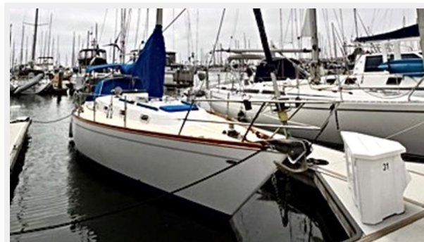
IMG_3115 Medium 2