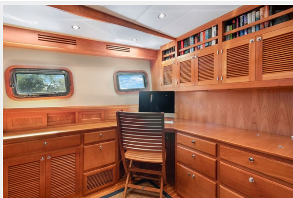
Office port side fwd