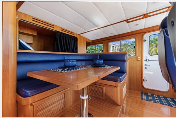
Pilothouse port side aft