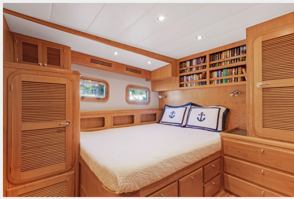
VIP stbd side aft