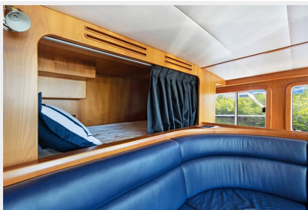
Pilothouse bunk above the seating area