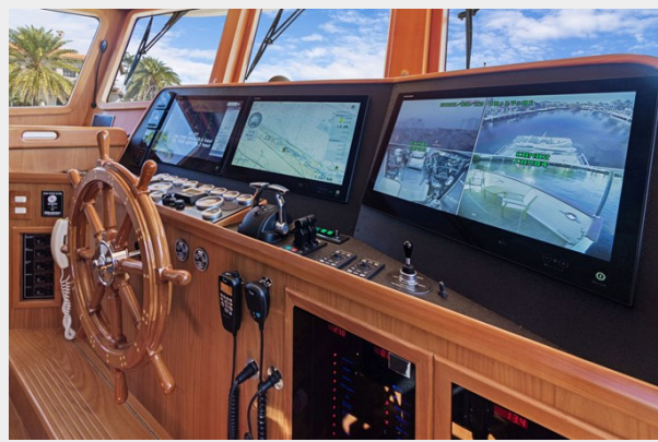
Pilothouse helm electronics