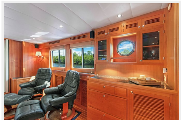
Salon port side looking aft