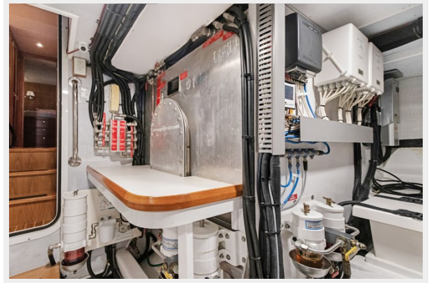
Engine room work bench fwd stbd side