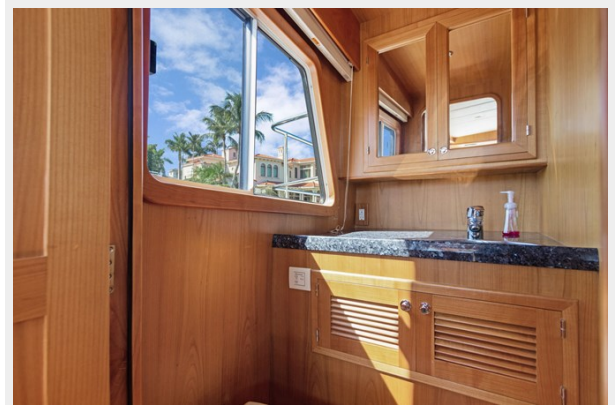
Pilothouse Day Head