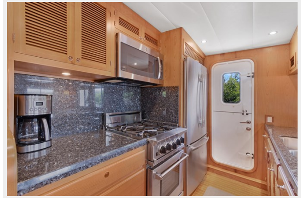
Galley facing fwd