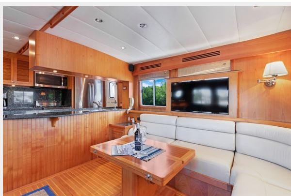
Salon stbd side looking fwd