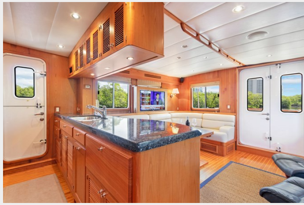
Galley looking aft to salon