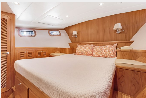
Master looking port side