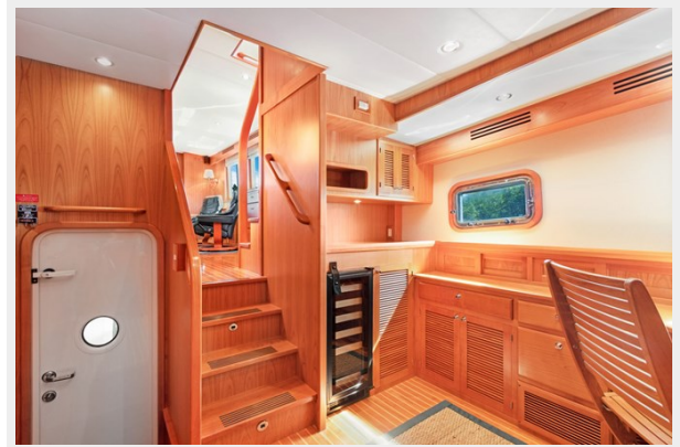
Office port side aft