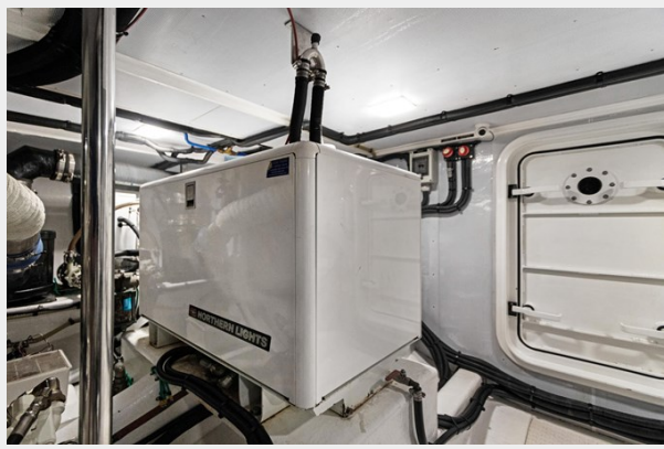
Generator stbd side