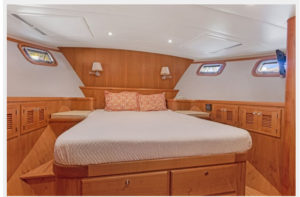
Master queen with storage each side