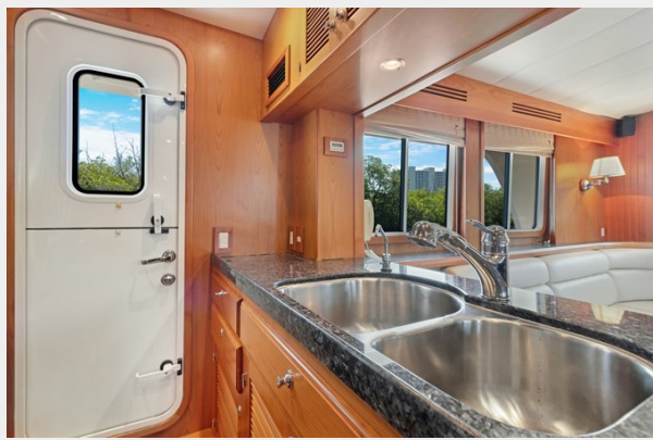
Galley and Dutch door on stbd