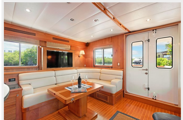
Salon stbd side TV up