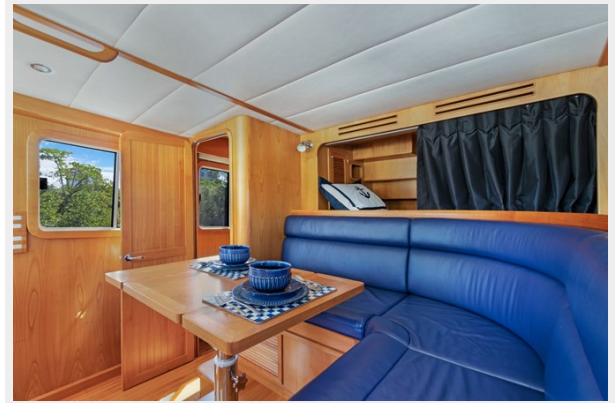
Pilothouse seating area aft