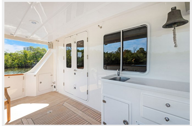
Cockpit facing fwd