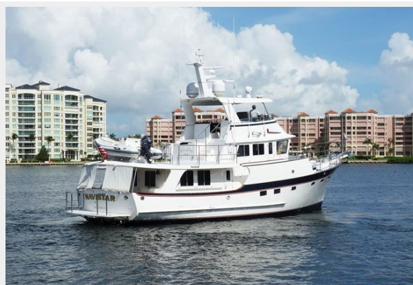
Aft stbd stern quarter