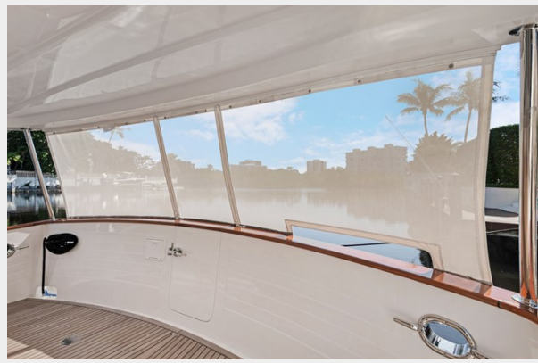
Cockpit sun screen