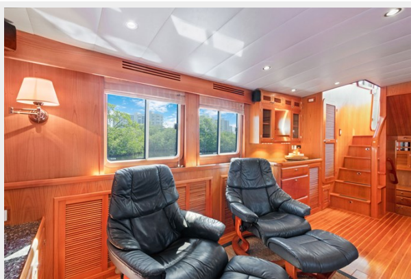
Salon port side looking fwd