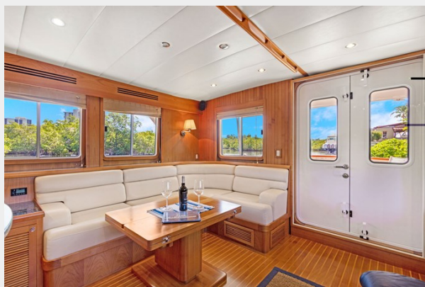
Salon stbd side aft