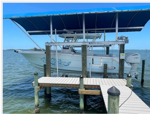
2023-robalo-r302-center-console- power-9422539- 20240609174613045-1_XLARGE