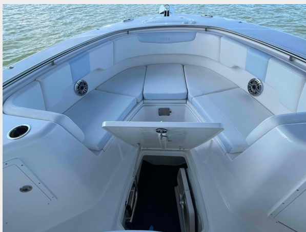
2023-robalo-r302-center-console- power-9422539- 20240609175050094-1_XLARGE