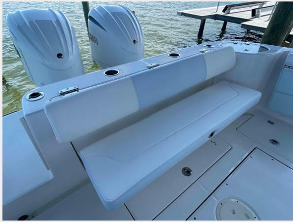
2023-robalo-r302-center-console- power-9422539- 20240609174640065-1_XLARGE