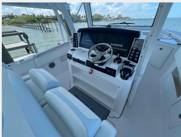
2023-robalo-r302-center-console- power-9422539- 20240609174628133-1_XLARGE