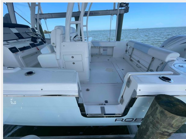
2023-robalo-r302-center-console- power-9422539- 20240609174616094-1_XLARGE