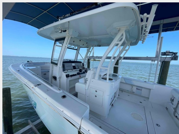
2023-robalo-r302-center-console- power-9422539- 20240609175056092-1_XLARGE