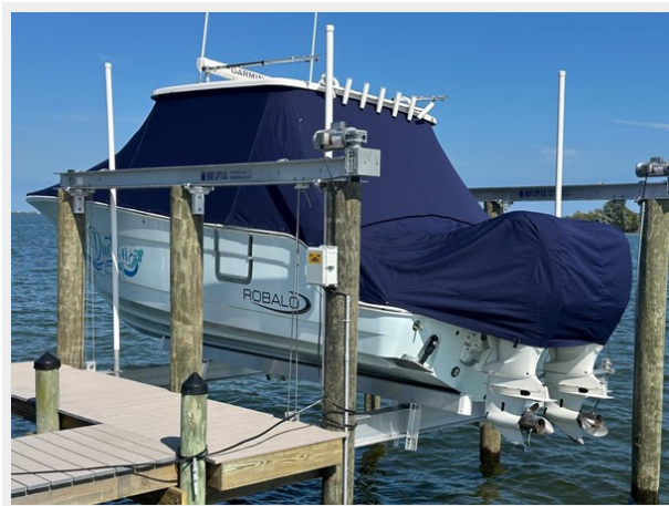
2023-robalo-r302-center-console- power-9422539- 20240609174610229-1_XLARGE