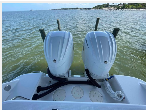
2023-robalo-r302-center-console- power-9422539- 20240609175316536-1_XLARGE