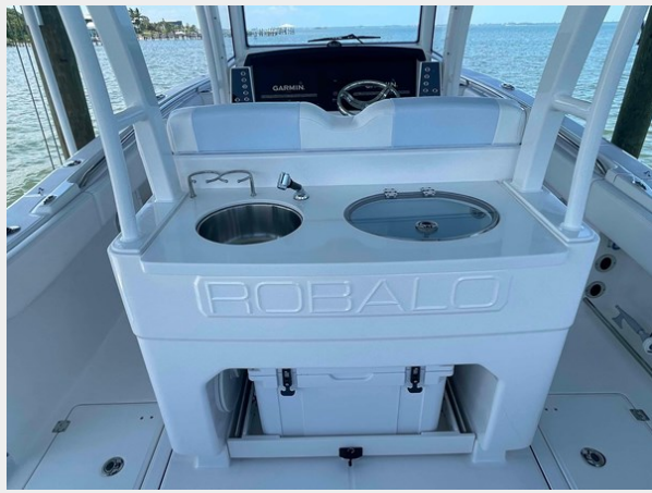
2023-robalo-r302-center-console- power-9422539- 20240609174622208-1_XLARGE