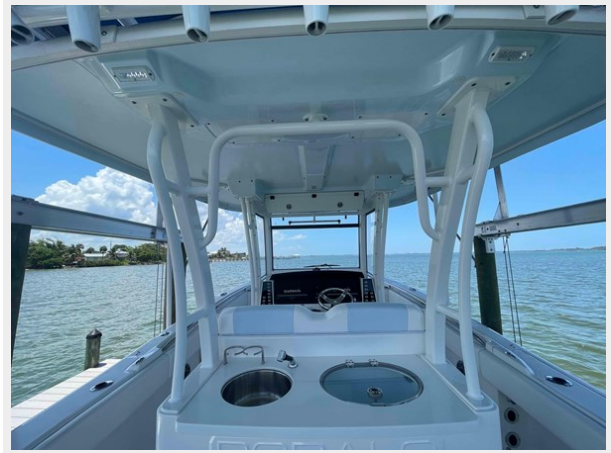
2023-robalo-r302-center-console- power-9422539- 20240609174625161-1_XLARGE