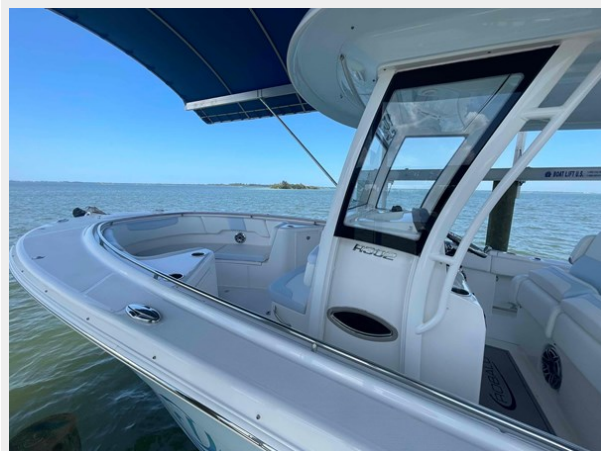
2023-robalo-r302-center-console- power-9422539- 20240609175102319-1_XLARGE