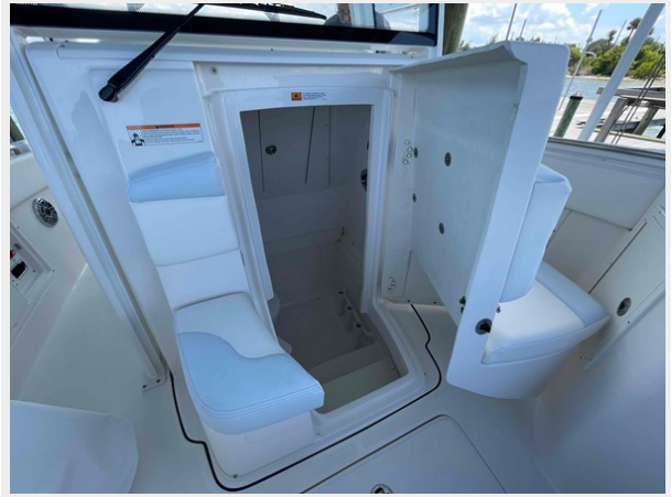
2023-robalo-r302-center-console- power-9422539- 20240609174643216-1_XLARGE