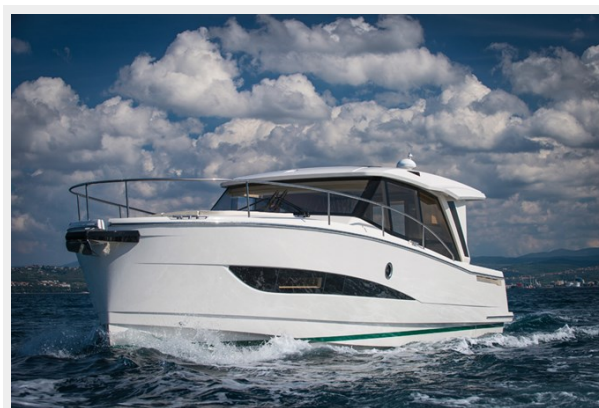
GL 39 (17)