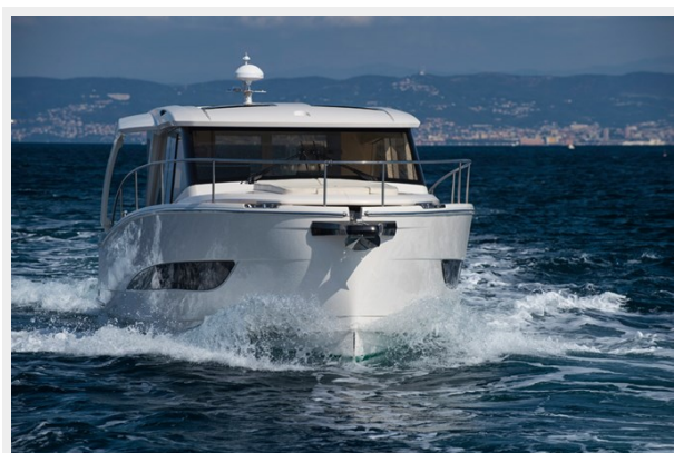
GL 39 (18)