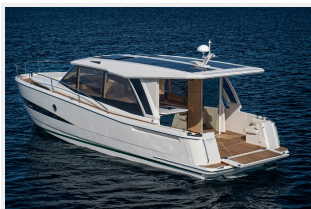
GL 39 (16)