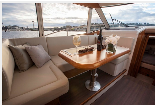
Dinette fwd 2