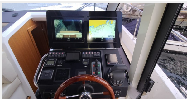
GL39-105 Garmin Electronics