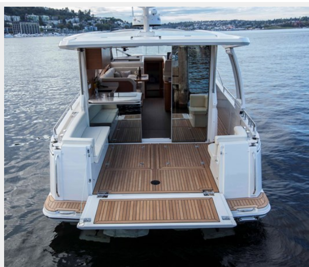
Cockpit beach club open