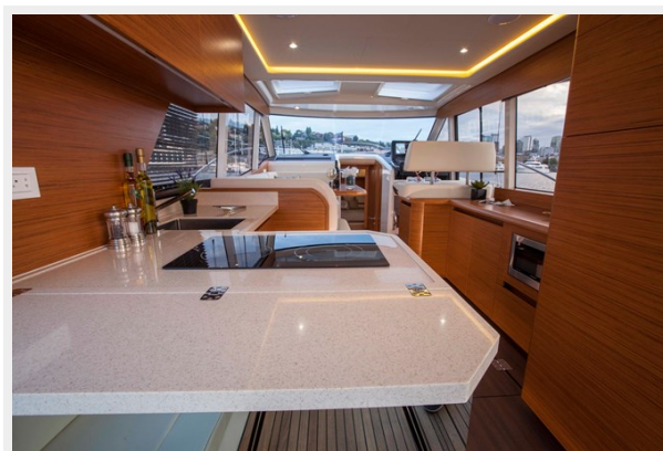
Galley bar fwd