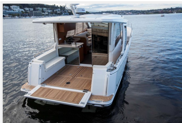
Cockpit beach club open 2