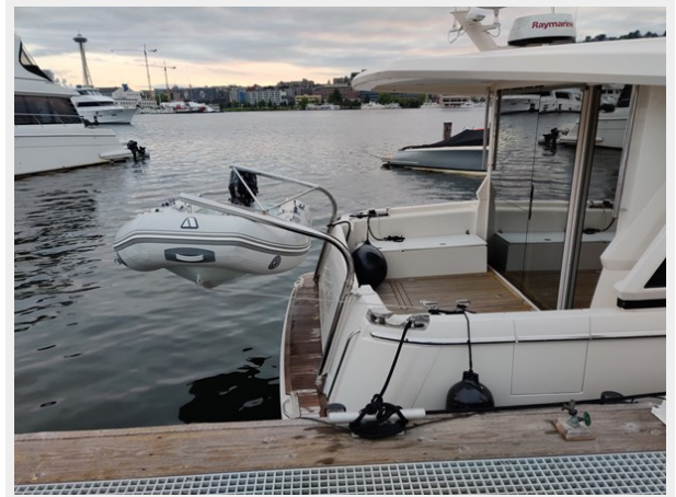
GL 39 Davit Seattle 2