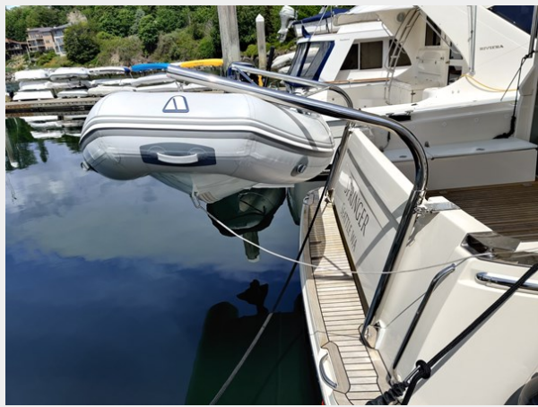
GL 39 Davit - Seattle 1