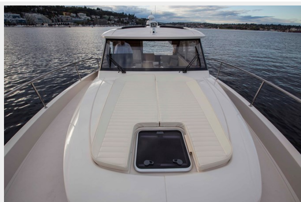
Fore deck aft sunpad