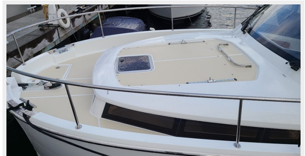
GL39-105 Deck non skid AwlGrip Paint