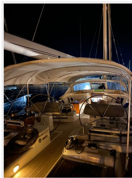
WhatsApp Image 2023-12-13 at 18.51.42 (1)