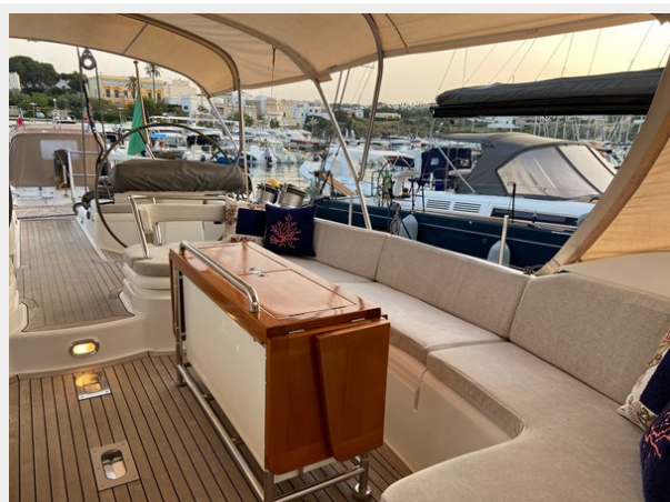
WhatsApp Image 2024-08-04 at 11.40.47