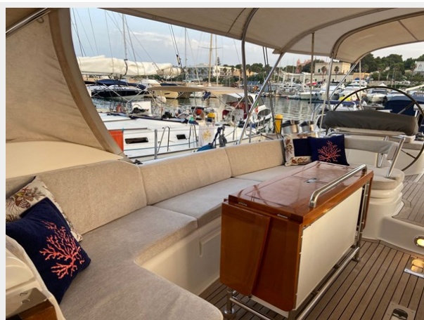
WhatsApp Image 2023-12-13 at 18.51.43 (1)