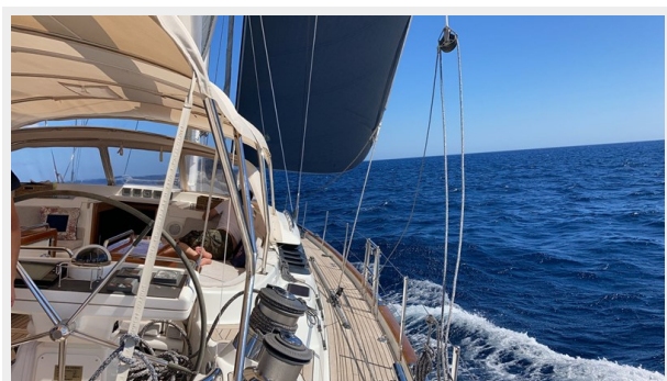
WhatsApp Image 2023-12-13 at 18.55.11 (1)