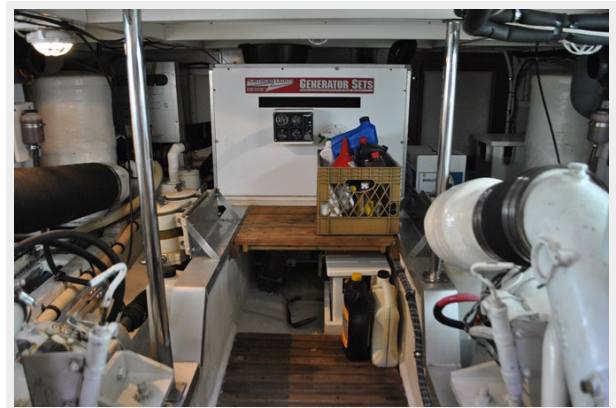
Engine Room Aft View