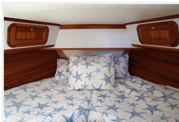
V-berth No Inset