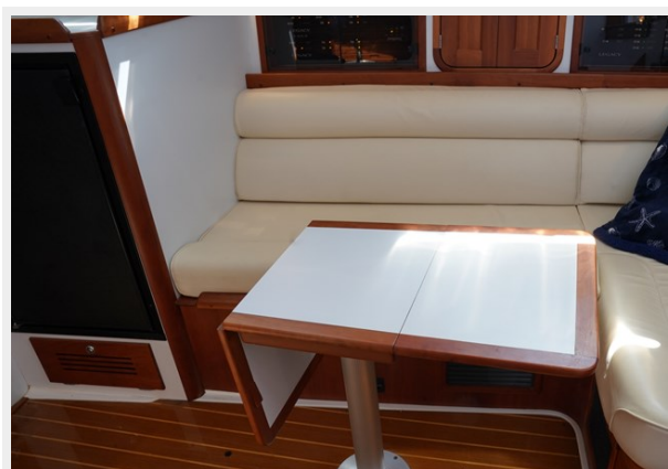
Galley Table with Aft Leaf