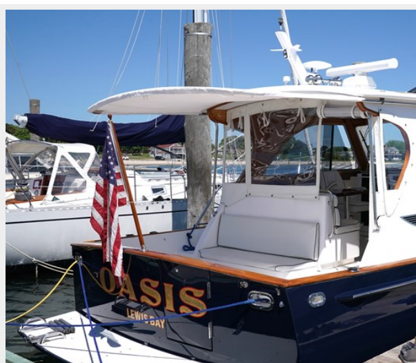
At Dock with Cockpit Canopy Extended