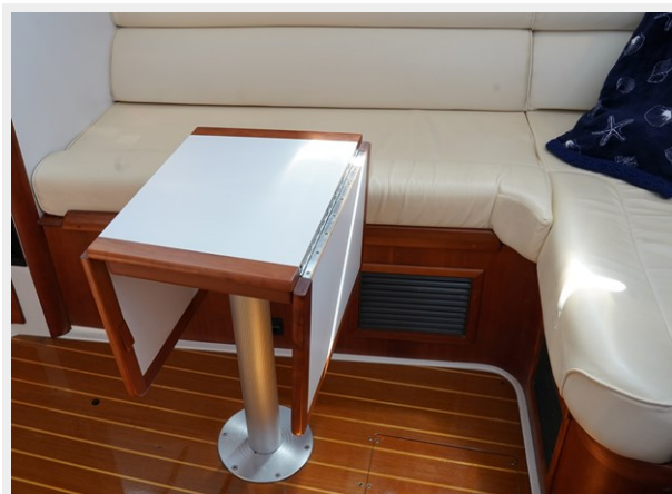
Galley Table Leafs down