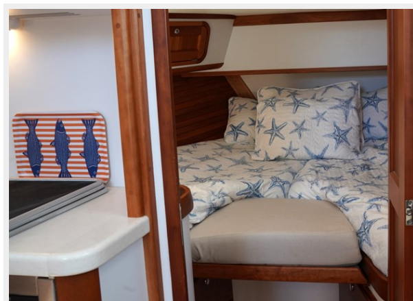
V-berth with Inset