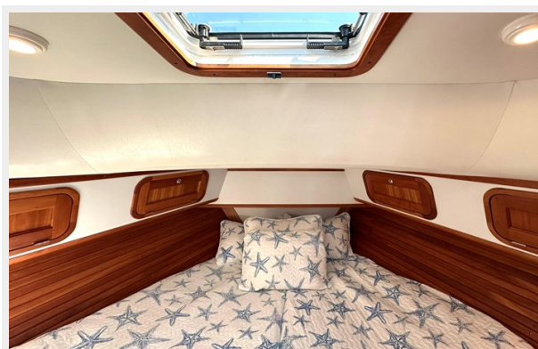
V-berth Amazing Light