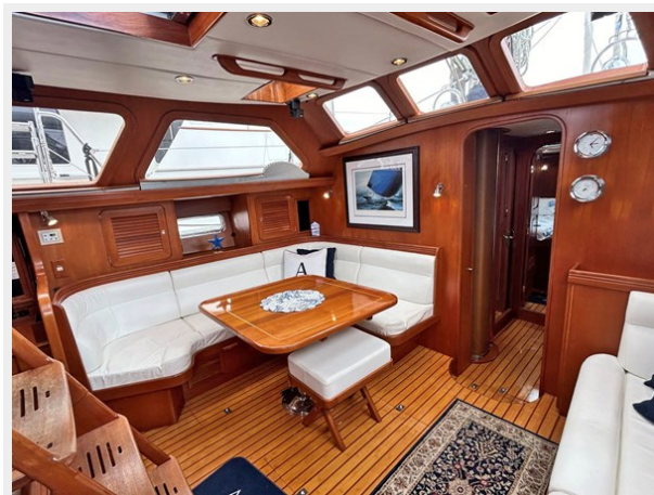
Main Salon, Port