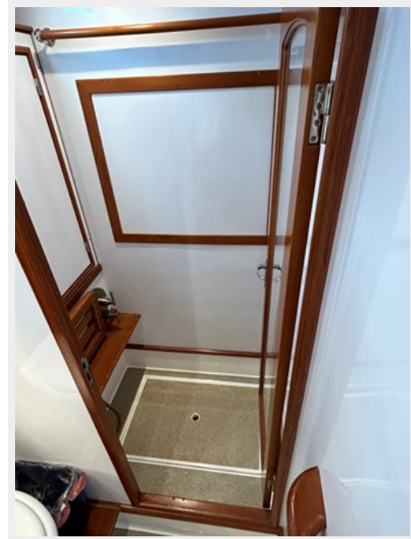
Owner's Shower Stall