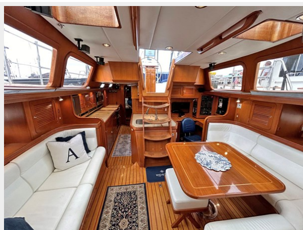
Main Salon, Aft