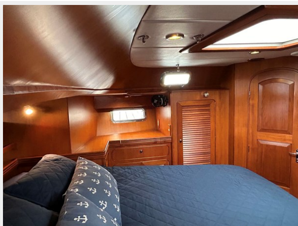
Owner's Cabin, Port