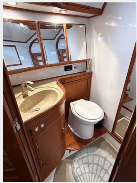
Owner's Private Head