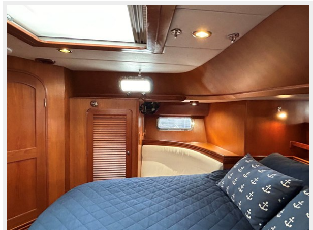
Owner's Cabin, Stbd