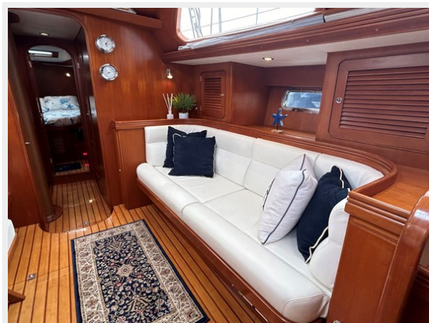
Main Salon, Stbd, Fwd