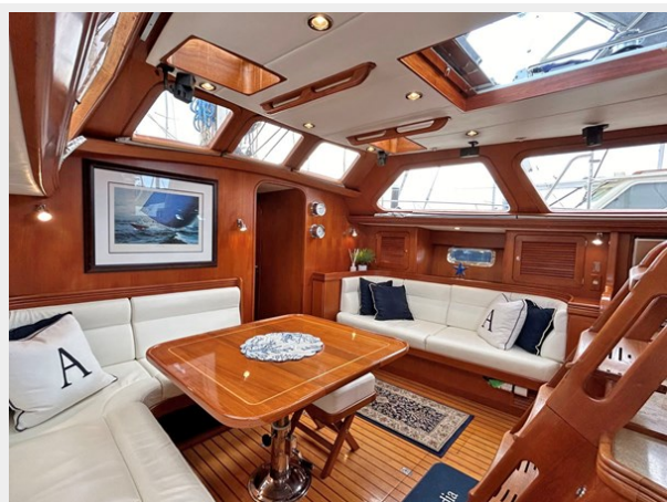
Main Salon, Fwd