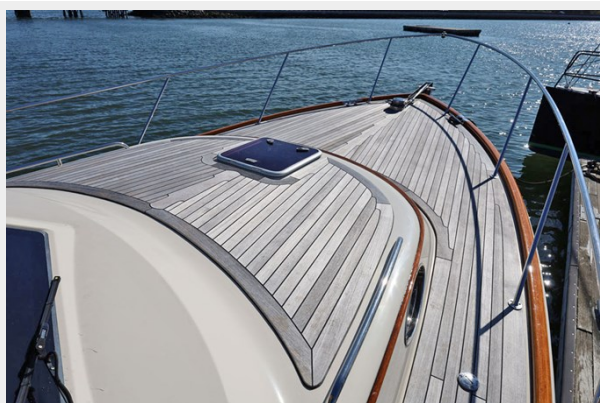
Cabin Top and Foredeck