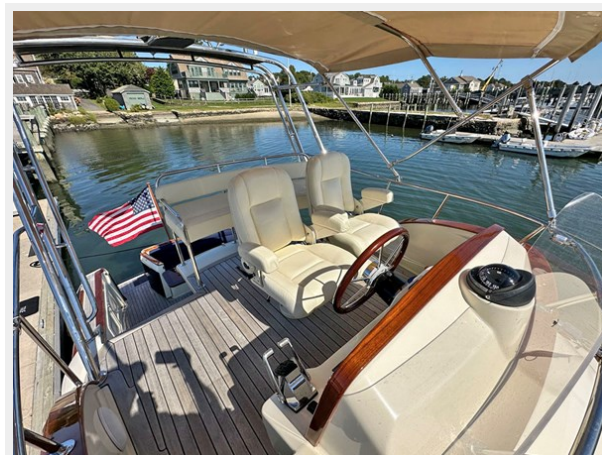
Flybridge Looking Aft