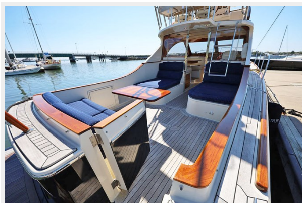
Transom Door Looking Into Cockpit