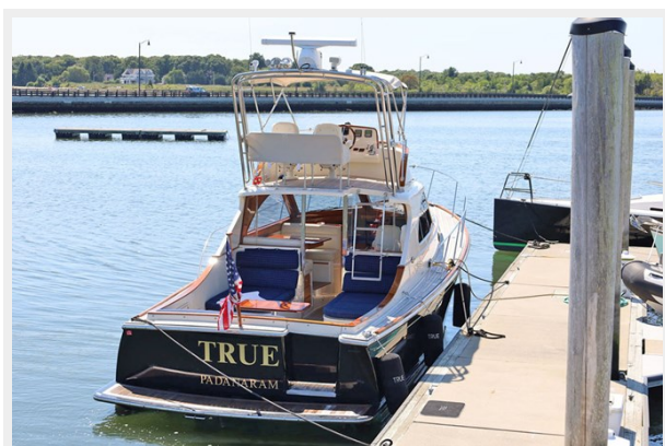
View From Astern