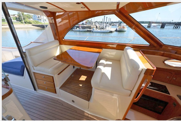
Convertible Dinette (electric)