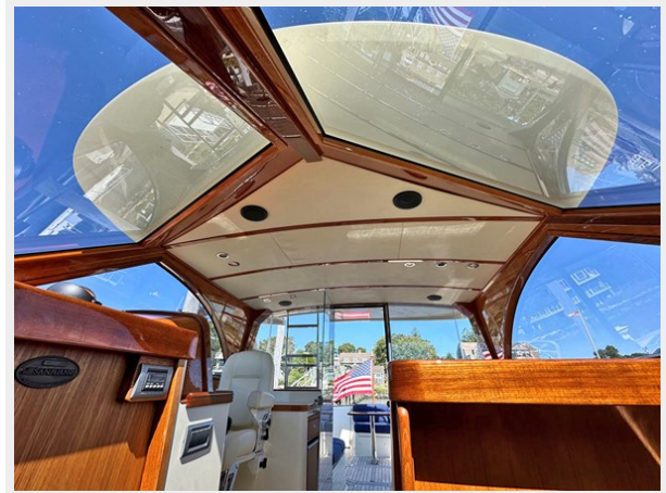
Underside of Hardtop