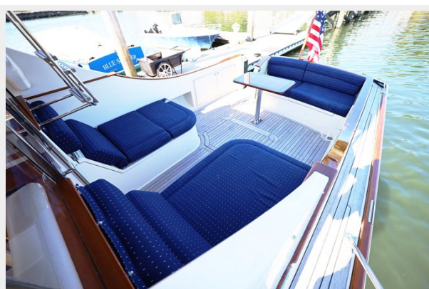
Cockpit Looking Aft from Side Deck