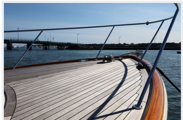
Foredeck Sweeping Forward