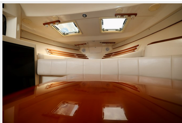
330 EXPRESS GRADY-WHITE 2003 SALON TABLE