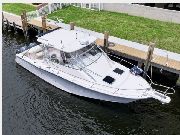
330 EXPRESS GRADY-WHITE 2003 BOW PROFILE