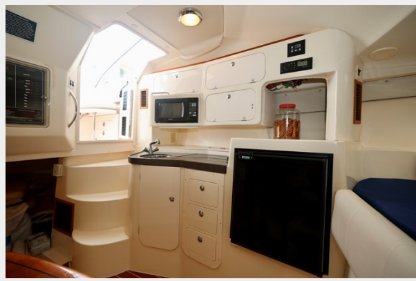
330 EXPRESS GRADY-WHITE 2003 GALLEY 3