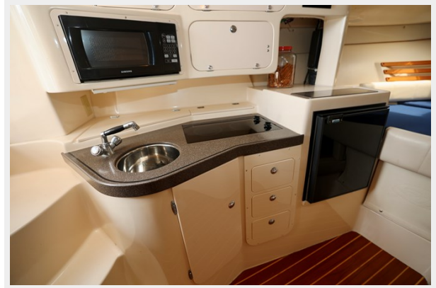
330 EXPRESS GRADY-WHITE 2003 GALLEY