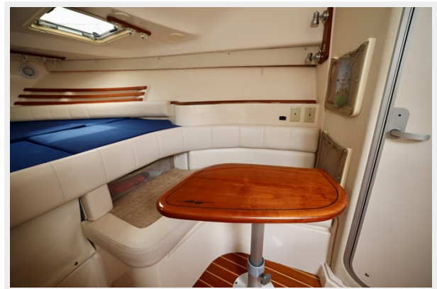
330 EXPRESS GRADY-WHITE 2003 SALON DINING