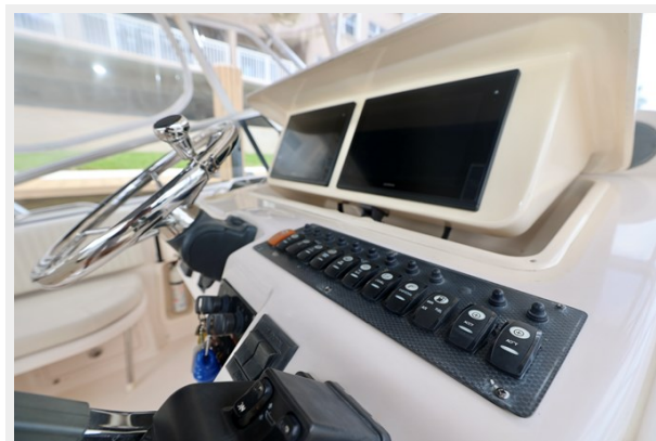
330 EXPRESS GRADY-WHITE 2003 HELM SWITCH PANEL