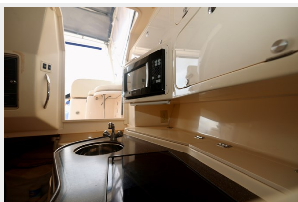
330 EXPRESS GRADY-WHITE 2003 GALLEY COUNTERTOP