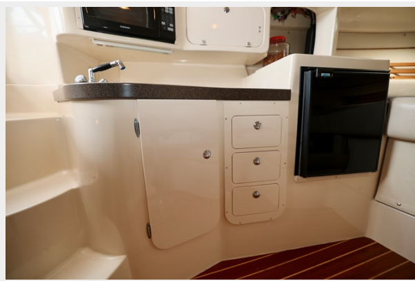
330 EXPRESS GRADY-WHITE 2003 GALLEY 2