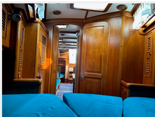
35 V berth Looking Aft