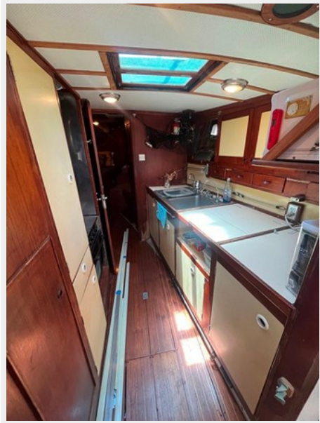
1975-cheoy-lee-offshore-53-ms-sail- 9490830-20240803134402500- 1_XLARGE