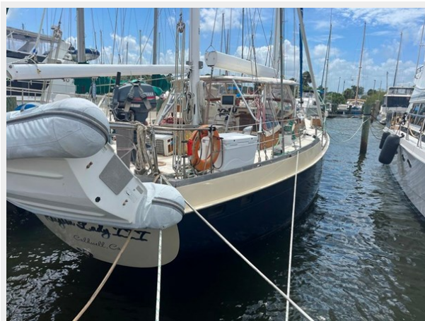
1975-cheoy-lee-offshore-53-ms-sail- 9490830-20240803134315751- 1_XLARGE