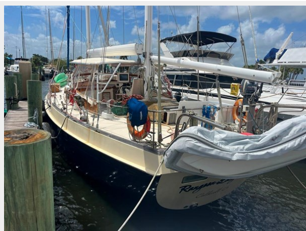
1975-cheoy-lee-offshore-53-ms-sail- 9490830-20240803134301257- 1_XLARGE