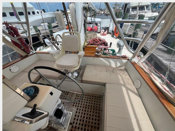
1975-cheoy-lee-offshore-53-ms-sail- 9490830-20240803134331582- 1_XLARGE