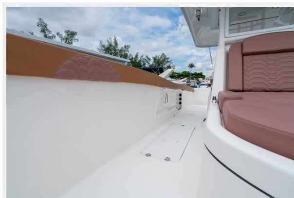
Stb Side Flooring