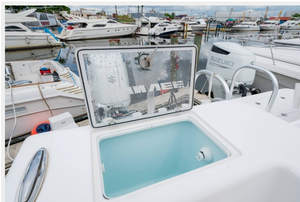
Stb Side Livewell