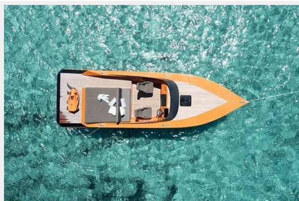
Say carbon 29_19