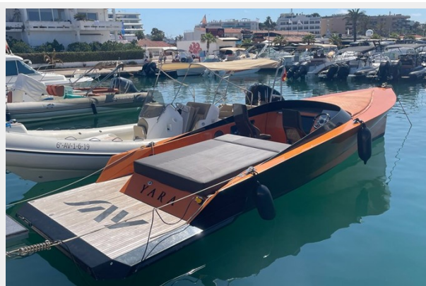
Say carbon 29_17