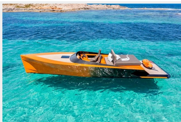
Say carbon 29_6