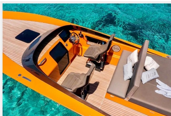
Say carbon 29_4