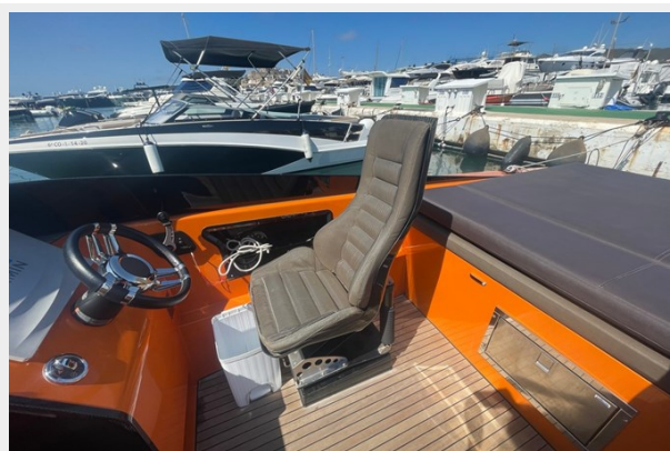
Say carbon 29_9