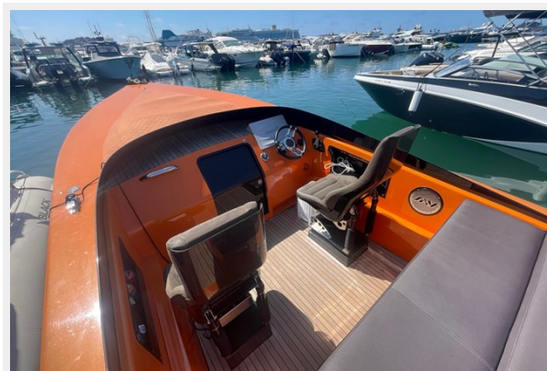
Say carbon 29_16