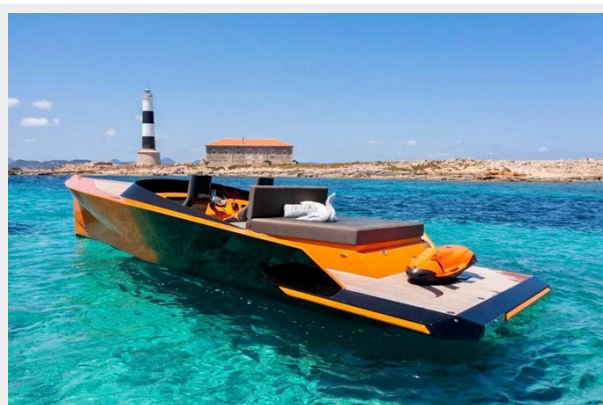
Say carbon 29_3