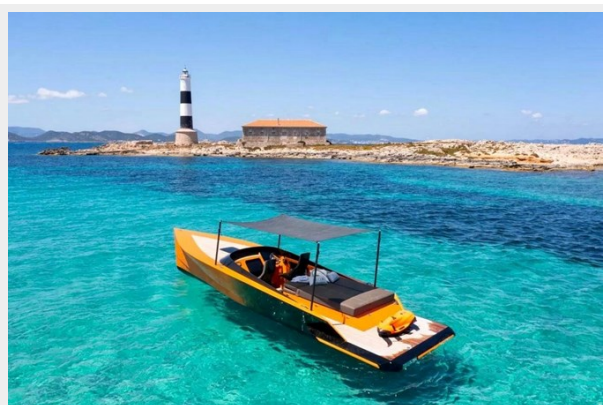
Say carbon 29_5