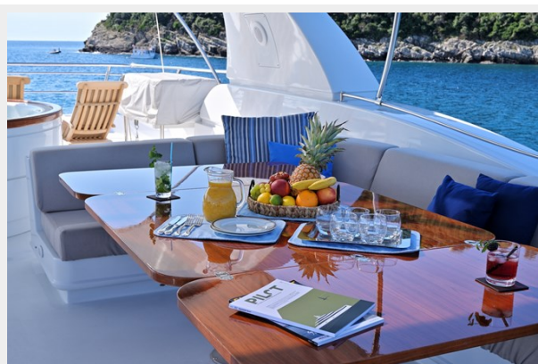
CLARITY sun deck table