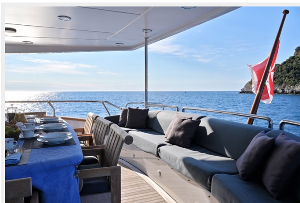
CLARITY aft deck seating