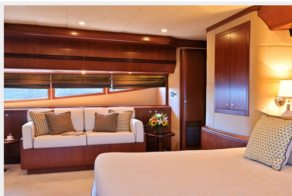
CLARITY master entrance