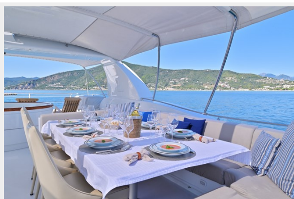
CLARITY sun deck dining