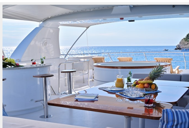
CLARITY sun deck bar