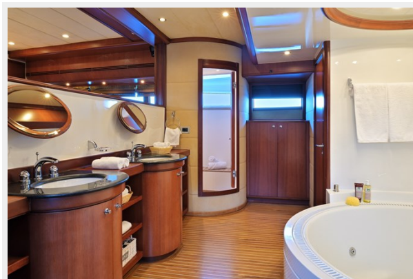
CLARITY master bathroom