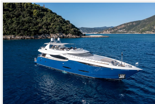
CLARITY bow quarter