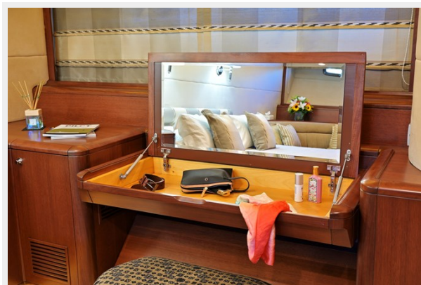
CLARITY VIP cabin vanity