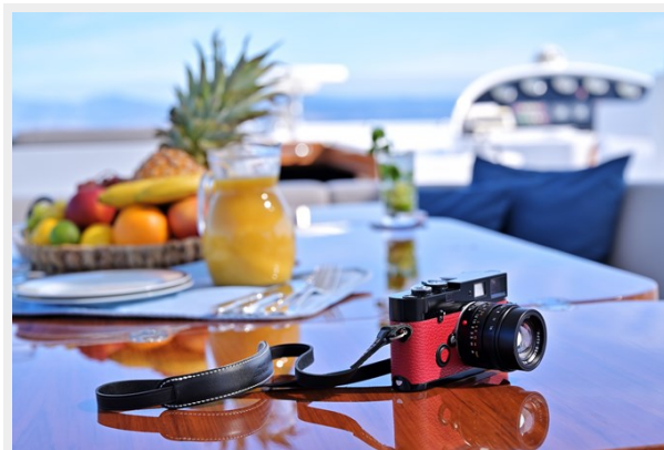
CLARITY sun deck table detail