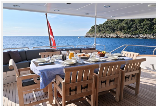
CLARITY aft deck table