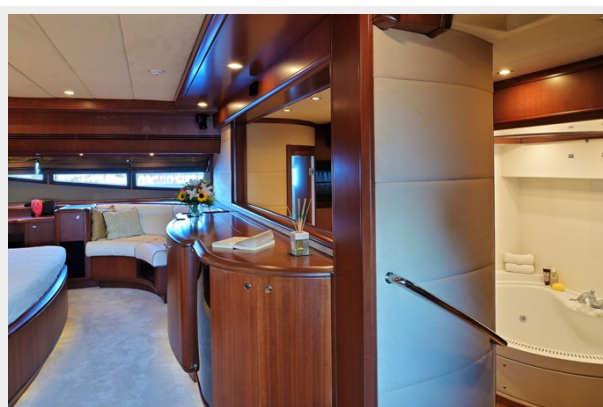
CLARITY master steps down to bathroom