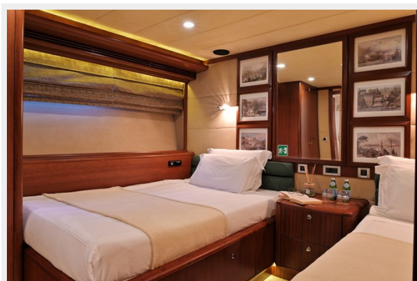
CLARITY guest twin aft