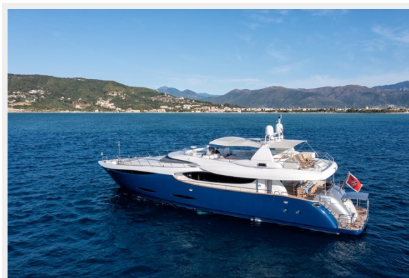
CLARITY profile garage open