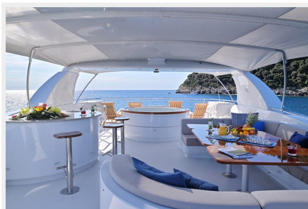
CLARITY sun deck wide