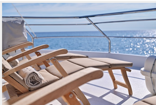
CLARITY sun deck loungers