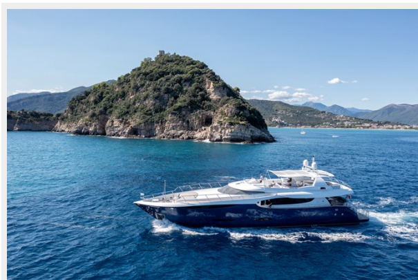
CLARITY run shot profile zoom out