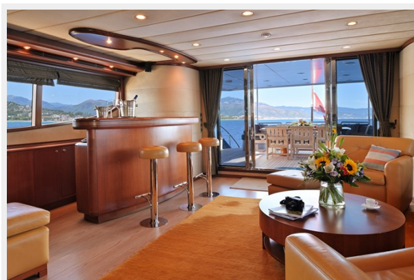
CLARITY saloon with bar