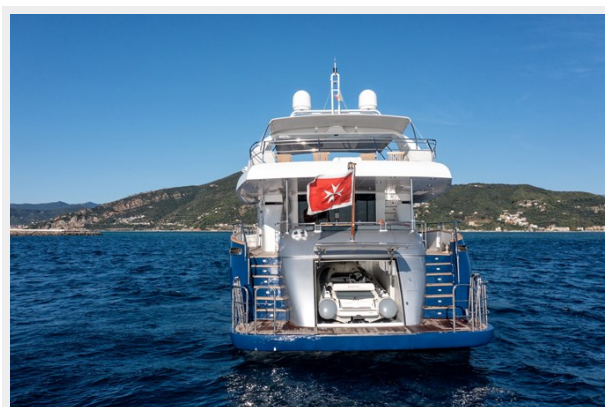
CLARITY garage open