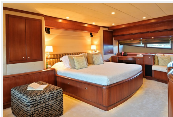
CLARITY master cabin