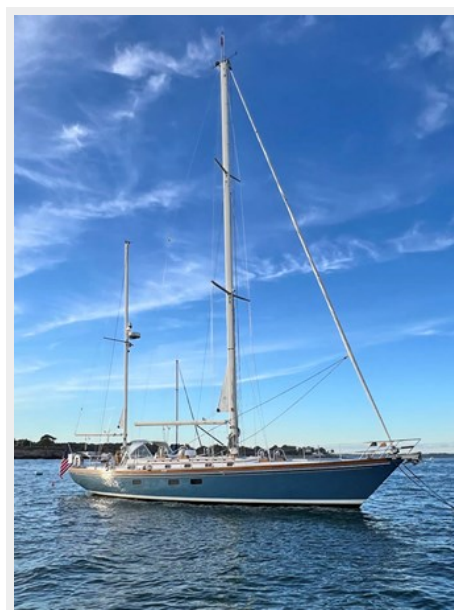
Stb Bow on Mooring