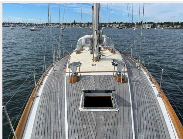
Foredeck Looking Aft