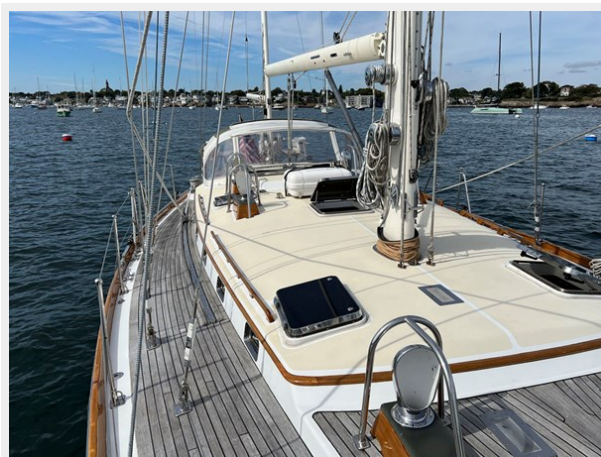
Mid Deck and Mast Base