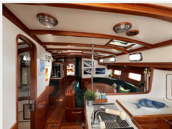
Salon and Galley Looking Forward