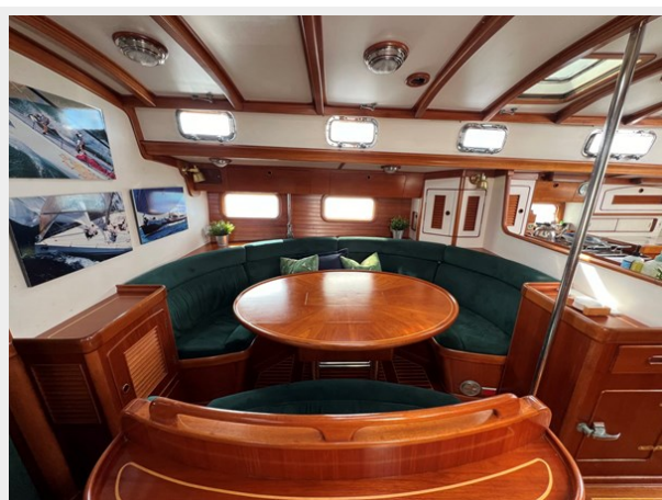
Salon Stbd Settee