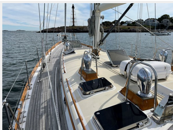
Port Side Deck