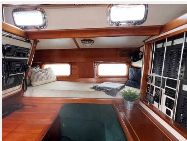
Pilot Berth at Nav Station