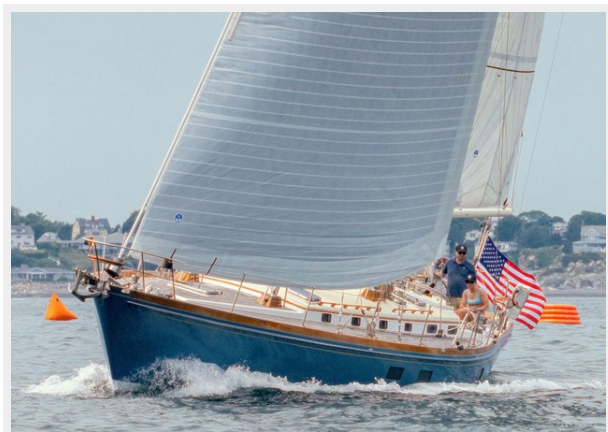
Sailing Stbd Tack