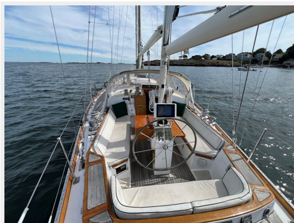
Cockpit Looking Fwd