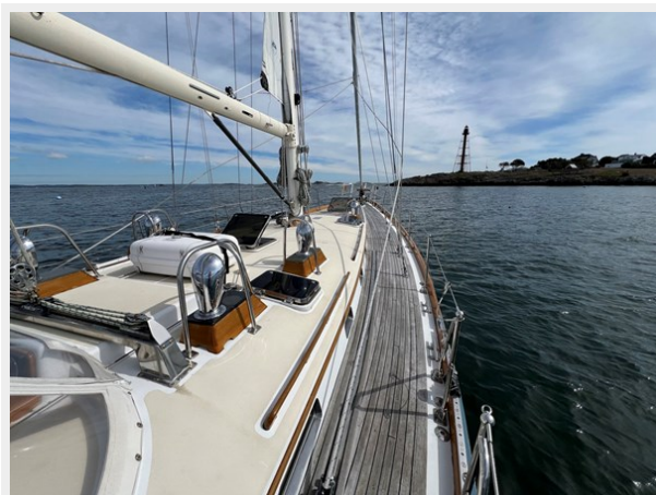
Starboard Side Deck