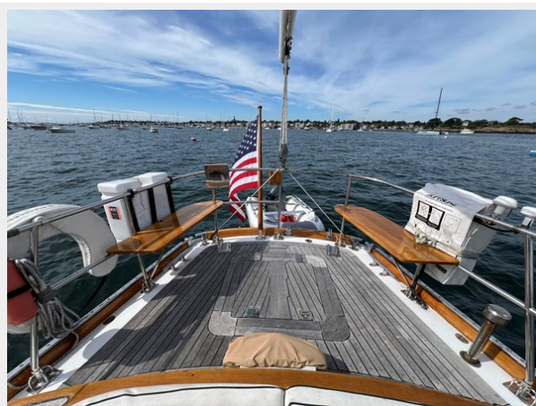
Aft Deck Looking Aft