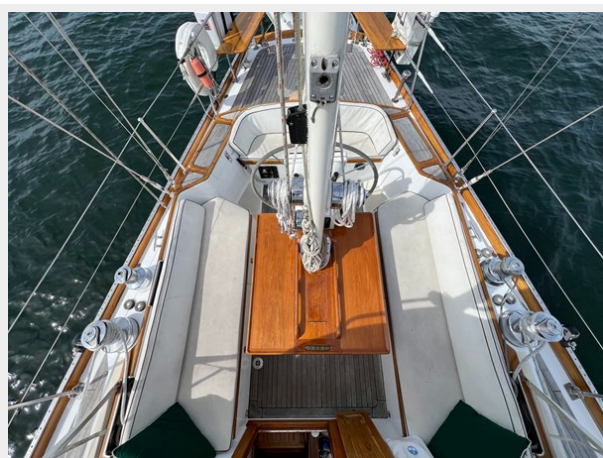
Cockpit from Above