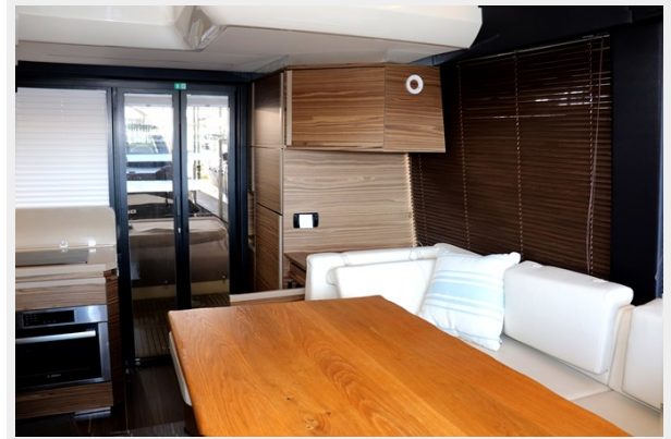
GALLEY / REFRIGERATOR