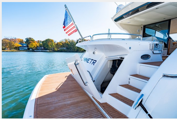
Entrance to Crew Quarters