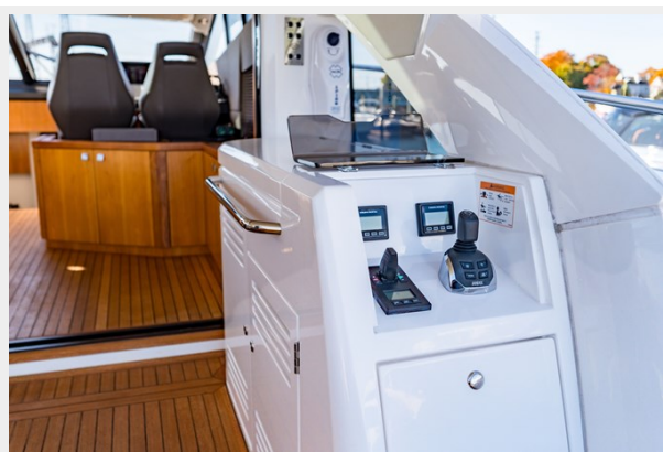
Joystick control station