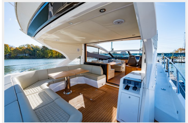
View forward from cockpit