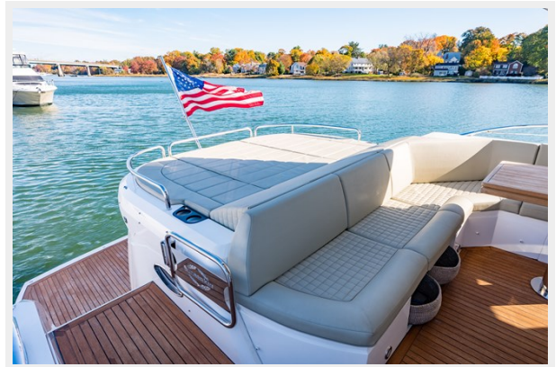
Steps down to hydraulic platform