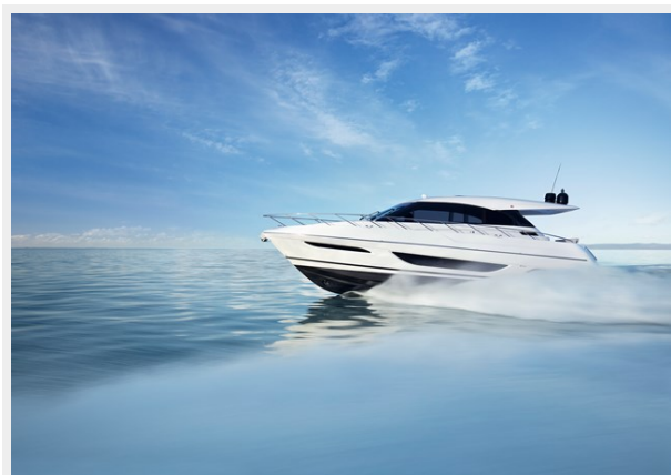
BMS Maritimo X50