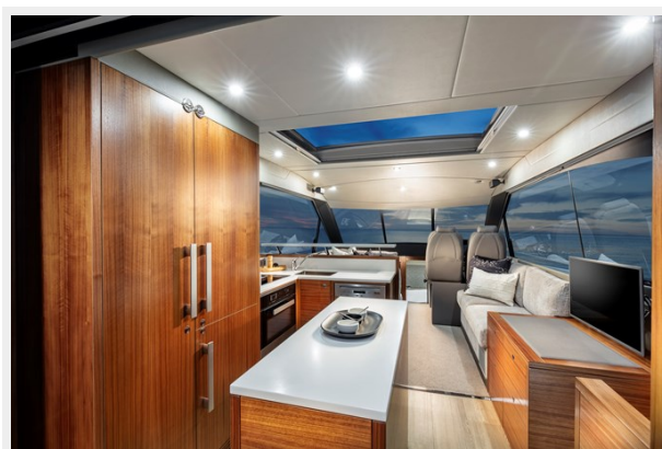
BMS Maritimo galley