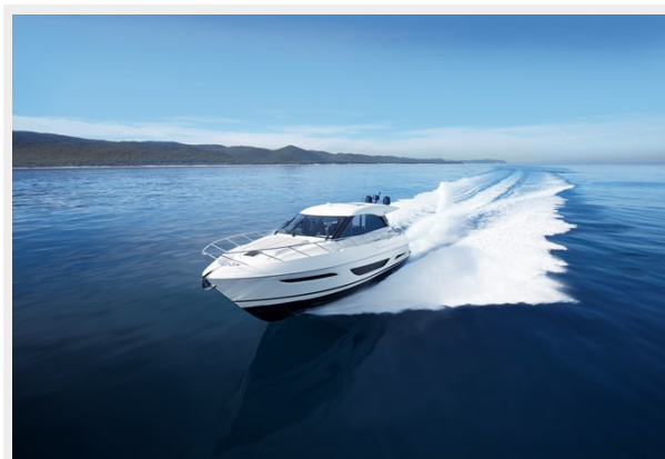
BMS Maritimo X50 Sports Yacht