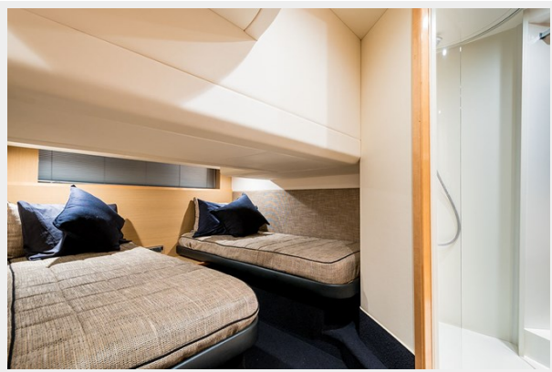
Princess V42 2010