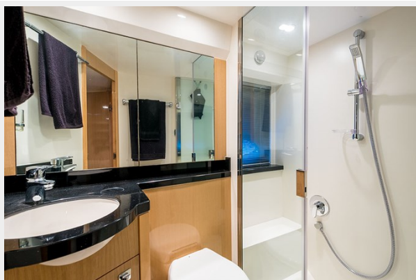
Princess V42 2010