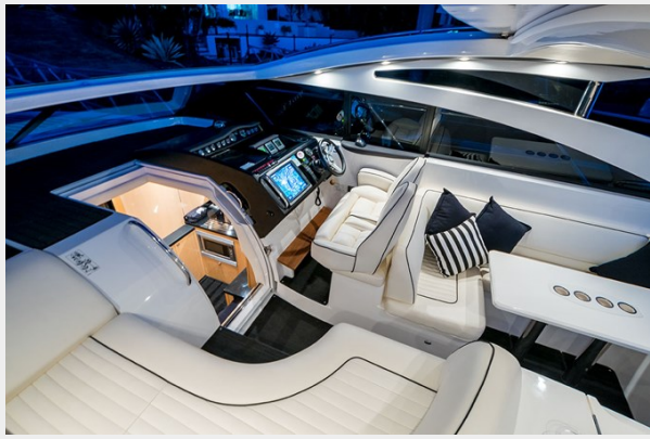
BMS Maritimo Princess