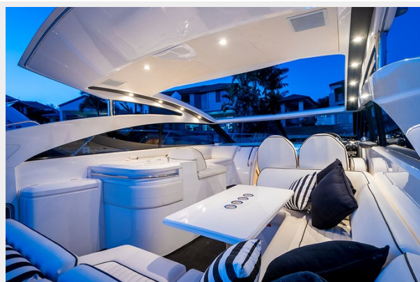
BMS Maritimo Princess