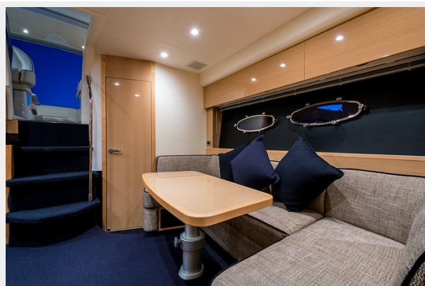
Princess V42 2010