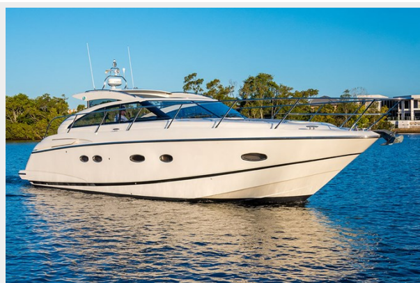
BMS Maritimo Princess