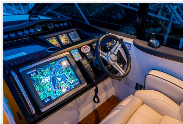
Princess V42 2010