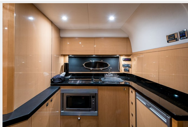
Princess V42 2010