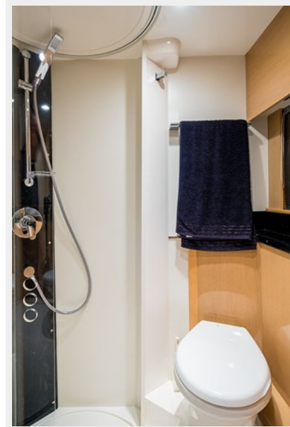
BMS Maritimo Princess