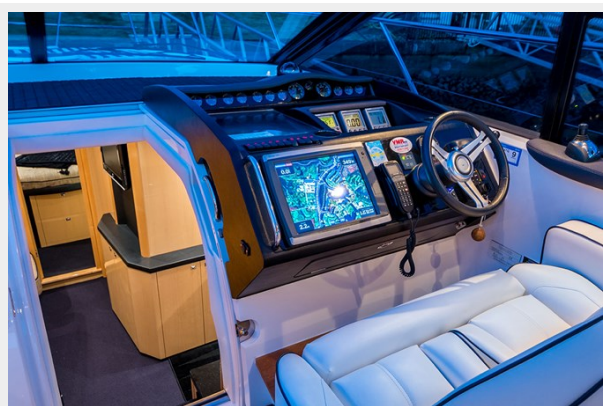
BMS Maritimo Princess