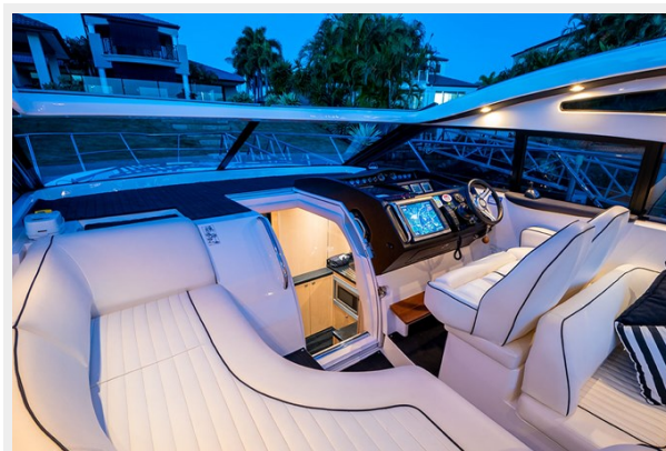
Princess V42 2010