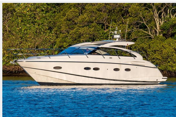
Princess V42 2010