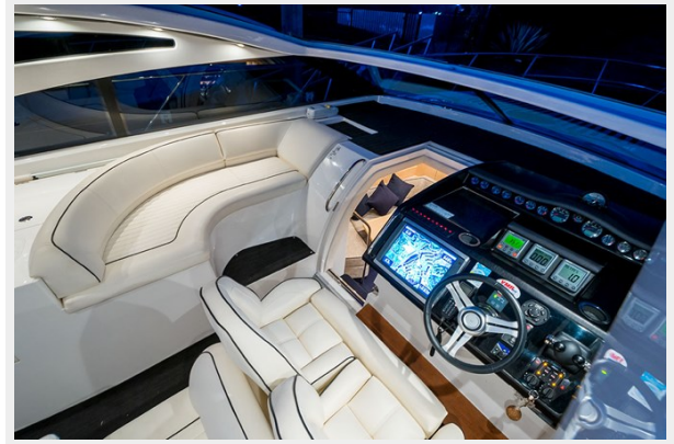
BMS Maritimo Princess