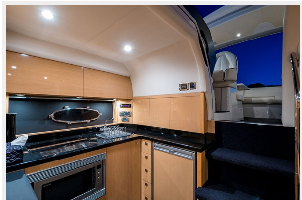
BMS Maritimo Princess