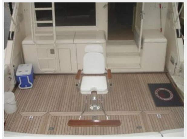
Bait Prep Center