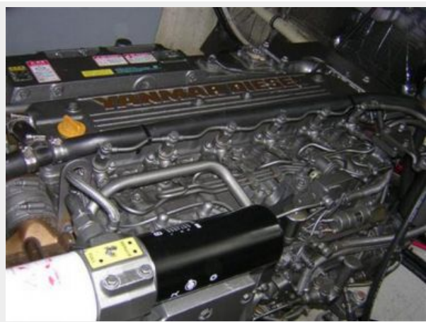
Port Yanmar Diesel