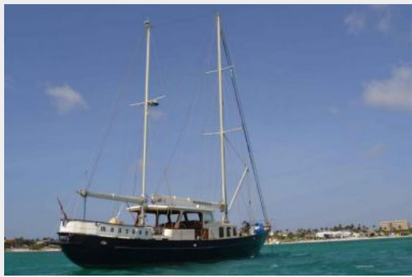
custom motorsailer for sale