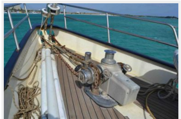
New teak deck